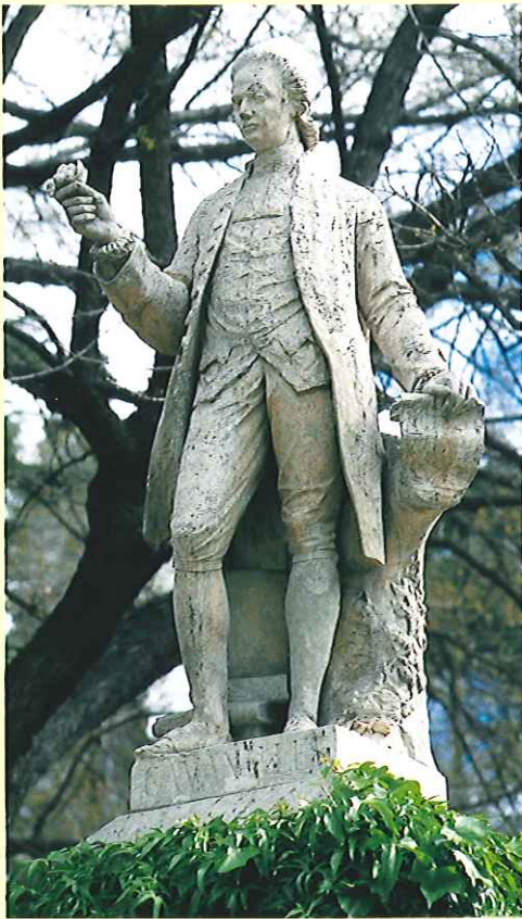
■ Estatua de Antonio José Cavanilles en el Jardín Botánico de Madrid.

La Revolución Francesa obliga al Duque del Infantado a volver a Madrid en 1789 y con él regresa también Cavanilles. En Madrid continuó la publicación de su obra hasta 1790. En esta época comienza a frecuentar el Jardín Botánico y a estudiar las plantas que allí se cultivaban, muchas de ellas procedentes de los territorios de ultramar. Fruto de estos trabajos es su magna obra Icones et descriptionem plantarum que publicó desde 1791 a 1801. Son seis volúmenes enriquecidos con 600 láminas grabadas, 100 por volumen, que contienen perfectas descripciones botánicas, muchas de ellas nuevas para la Ciencia. El método de trabajo riguroso y científico seguido por Cavanilles levantó malestar entre ciertas autoridades relevantes del Jardín madrileño, hasta tal punto que en 1796, el científico valenciano saca a la luz la Colección de papeles sobre controversias botánicas donde defiende su forma de trabajar de las opiniones de sus antagonistas. Cavanilles siguió publicando sistemáticamente sus trabajos pues no sólo gozaba de la protección del Duque del Infantado, que