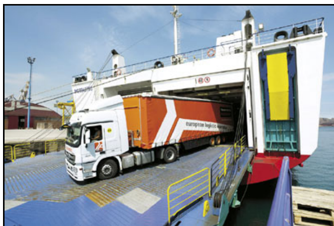
Barco RO-PAX y desembarco de vehículos.