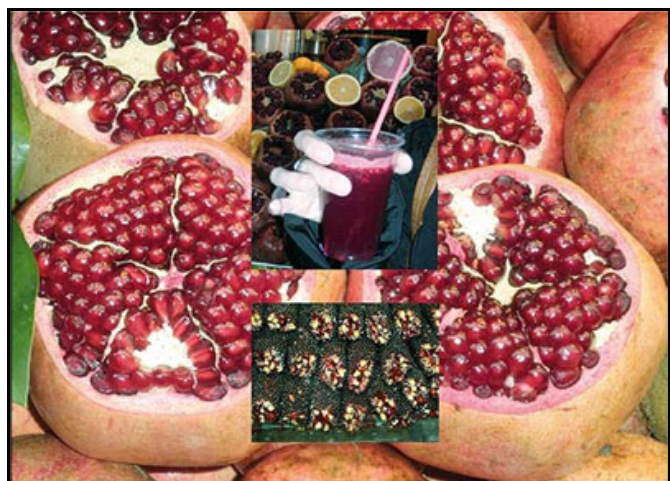
Granadas, zumos y dulces comercializados en Estambul.