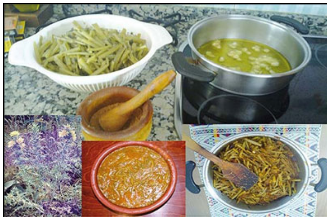
Tagarninas ( Scolymus hispanicus). Preparación en cocina y dos recetas de tagarninas "esparragás".