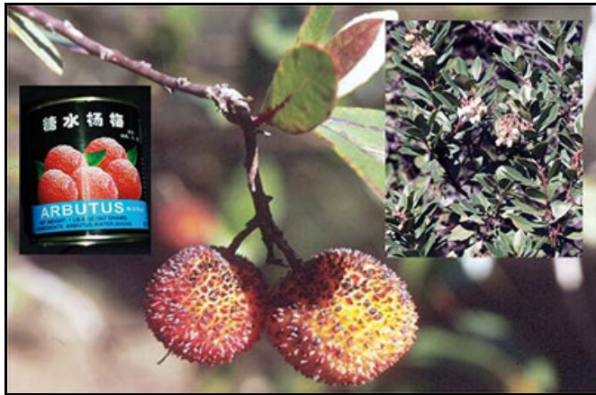
Arbutus unedo (madroño). Frutos, planta y enlatado de sus frutos (icomercializado en China!).

sino también algunas más selectas como Armoracia rusticana (rábano picante) y la oriental Wasabia japonica (el wasabi), hoy muy popular por su uso como condimento del sushi; Cariofiláceas como Silene inflata (collejas); Campanuláceas ( Campanula rapunculosa ); Poligonáceas: Rumex acetosa (acedera) y otras especies del mismo género; Portulacáceas, como la muy exquisita verdolaga ( Portulaca oleracea ); y entre las Quenopodiáceas: Atriplex hortensis (armuelle), cenizas como el vulgar Chenopodium album o el endemismo ibérico, Chenopodium bonus-henricus y diversas barrillas y hierba-saladas de los géneros Salsola y Salicornia , interesantes por su extrema adaptación a los suelos salinos.