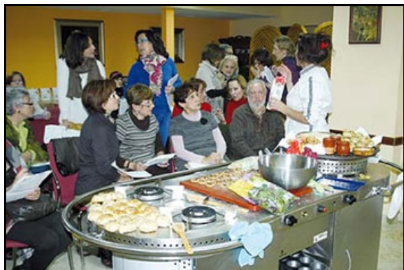
Clase de cocina utilizando NUS (quinoa, chia, amapola, lino, amaranto ...) Cursos de la Cátedra Intergeneracional en la Universidad de Córdoba.

Un capítulo de especial relevancia en este sentido es la información procedente de los informantes actuales, esto es del saber popular vivo, respecto a las especies silvestres recolectadas como alimento. Muchas de ellas no son sino el resultado del asilvestramiento de antiguos cultivos, mientras que otras, permanecen todavía en un proceso incipiente de domesticación. En cualquiera de los casos se trata muchas veces de especies que presentan altos valores nutricionales, dietéticos o incluso medicinales y posibilitan el desarrollo y puesta en valor de fórmulas locales de gastronomía. Estamos hablando de plantas como tagaminas, collejas, espárragos silvestres, acederas y romazas, cenizos, verdolaga, guardalobo, alcauciles, cardillos, berros, diente de león, nueza, rusco, sauco, zarzamoras, madroños, achicorias, hinojo..., la lista puede ser de nuevo muy prolija. Morales et al. (2002) se ocuparon hace algún tiempo de recoger toda la información relativa a la Comunidad de Madrid y más recientemente (Morales et al. , 2011) realizaron una estimación de la flora silvestre ibérico-balear de interés alimentario que es objeto de colecta y la cifra supera el 6.5 % de la flora, esto es, más de 500 especies.