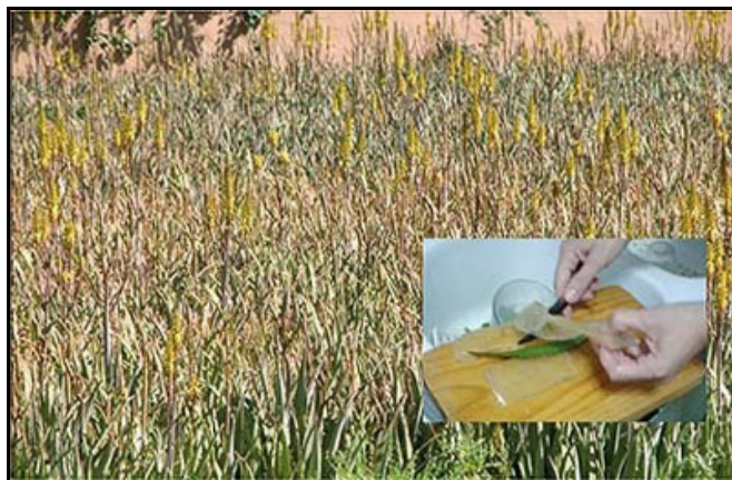
Cultivo de Aloe Vera. Extracción del parénquima para su uso en postres y pastelería.

En otros casos y como hemos indicado más arriba, al haberse podido conservar nuestras antiguas variedades y cultivos en el contexto agrícola de otros países, también tendremos que recurrir a los acuerdos de transferencia, pero probablemente podremos hacerlo, si esto se plantea de forma lógica e inteligente, en el marco de una cooperación biunívoca que beneficie tanto a los intereses de la agricultura española como a los del país de procedencia. Y de nuevo será necesaria una política clara y decidida de la administración, estableciendo objetivos estratégicos y facilitando este tipo de acuerdos. Determinados países de Latinoamérica, del Norte de África y Mediterráneo deberían ocupar ese espacio de prioridad.