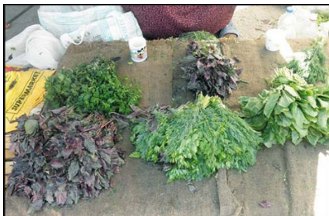
Amaranthus gangeticus . Bledos asiáticos como verdura de hoja en un mercado de Turkmenistán.

cierta cronología de este progresivo enriquecimiento a través de los escritos de naturalistas, médicos, agrónomos y hasta de los literatos griegos y romanos (Estrabón, Plinio, Dioscórides, Virgilio) y mejor todavía gracias a los autores hispanorromanos e hispanovisigodos (Columela, Isidoro de Sevilla). Por lo tanto y con anterioridad a la influencia árabe, el elenco de especies útiles al hombre en la Península Ibérica era ya notablemente diverso.