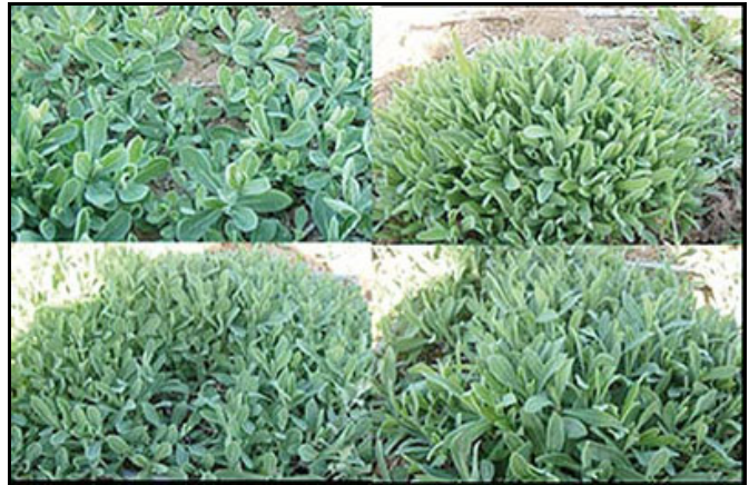
Vista general de 4 genotipos de colleja procedentes de reproducción vegetativa.