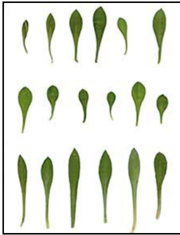
Diversidad morfológica en hojas de Silene vulgaris .

Con el desarrollo de la Agricultura, el hombre ha ido poniendo en cultivo un gran número de especies vegetales, comenzando por aquellas especies que, por una razón u otra, más le gustaban o se adaptaban más fácilmente al cultivo como los cereales y las leguminosas. Sin embargo, también se domesticaron verduras como la lechuga o la col, especies que, a diferencia de cereales y leguminosas, son plantas aprovechadas por sus hojas y se reproducen por semillas, por lo que su domesticación fue peculiar (Ladizinsky, 1998). Sin embargo, hay numerosas especies que se han consumido como verdura y nunca han sido domesticadas. Son las que se vienen a denominar criptocultivos en referencia a que se desarrollan en los campos de cultivo o en su entorno y son aprovechadas por las personas sin dejar su condición de planta silvestre (Rivera y Obon, 2006). Son plantas que se protegen y que nunca llegan a ostentar el título de planta cultivada pero la intervención humana afecta a la dinámica de sus poblaciones. Esto suele ocurrir en los sistemas campesinos.