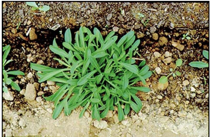
La colleja tal y como se encuentra en el campo.

En los últimos años ha ido surgiendo numerosa literatura acerca de la importancia de la agrodiversidad en su relación con la seguridad alimentaria de las diversas poblaciones humanas y se ha visto que la mayor parte de los alimentos producidos en el planeta se consiguen en modelos de agricultura de pequeña escala. Y es en este contexto histórico -en el que se cuestiona la capacidad del planeta para alimentar a los 9000 millones de personas que se estima habrá en 2050- donde la agroecología emerge como una solución hacia un desarrollo sostenible y equitativo ya que aporta las bases científicas, metodológicas y tecnológicas para una nueva “revolución agraria” (Altieri et al 2011). No en vano, la mayor parte de la comida consumida en el mundo se produce bajo el modelo de agricultura campesina. Concretamente, la agricultura de pequeña escala en América Latina está representada por 16 millones de pequeñas explotaciones que contribuyen con, aproximadamente, el 41% de la producción destinada al consumo doméstico. Esto significa que produce, a nivel regional, el 51% del maíz, el 77% de judías y el 61% de patatas (Altieri, 2004).