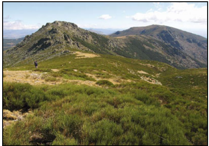
Cuerda Larga en verano con la loma de los Bailanderos y la Najarra al fondo.

Sin embargo, no cabe desconocer que los anteriores planteamientos quedaban en gran medida desvirtuados al establecerse el carácter meramente honorífico de las nuevas declaraciones. Así, mientras el Reglamento de 1917 renunciaba a señalar reglas fijas y precisas para todos los parques nacionales, remitiéndose a las normas especiales que se dieran para cada territorio protegido, la Real Orden de 1927 desistió de cualquier intento de lograr una efectiva tutela estableciendo paladinamente que: "La declaración oficial de sitio o de monumento natural de interés nacional es de carácter meramente honorífico para los municipios en cuyo término existan estas bellezas naturales, así como para las corporaciones oficiales, entidades públicas o privadas y particulares a quien pertenezcan, con el exclusivo objeto y sin otro alcance que el de respetar y hacer que se respeten tales bellezas evitando su destrucción, deterioro o desfiguración por la mano del hombre, y de favorecer en lo posible su acceso por vías de comunicación; y perderán dicho carácter cuando, por causa intencionada o por desidia, desaparecieran o se aminoraran notablemente los fundamentos de tal distinción."