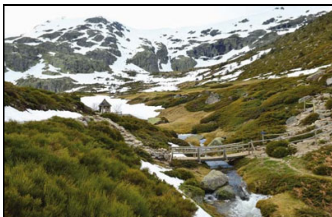
La Sierra de Guadarrama fue uno de los primeros espacios que reclamaron la atención de los pioneros de la conservación en España.

La necesidad de espacios libres y de zonas verdes comenzaba a sentirse en las ciudades, lo que permitió presentar la figura de los parques nacionales en los siguientes expresivos términos (Apéndice de legislación de Alcubilla, 1916): " No bastan ya, en efecto, los paseos o parques urbanos, que todas las ciudades han procurado tener como lugares de esparcimiento y de higiénico ejercicio, sino que se requiere además que haya parques nacionales, esto es, grandes extensiones de terreno dedicado a la higienización y solaz de la raza, en que puedan tonificarse física y moralmente los cansados y consumidos por la ímproba labor y por respirar de continuo el aire viciado de las poblaciones. "