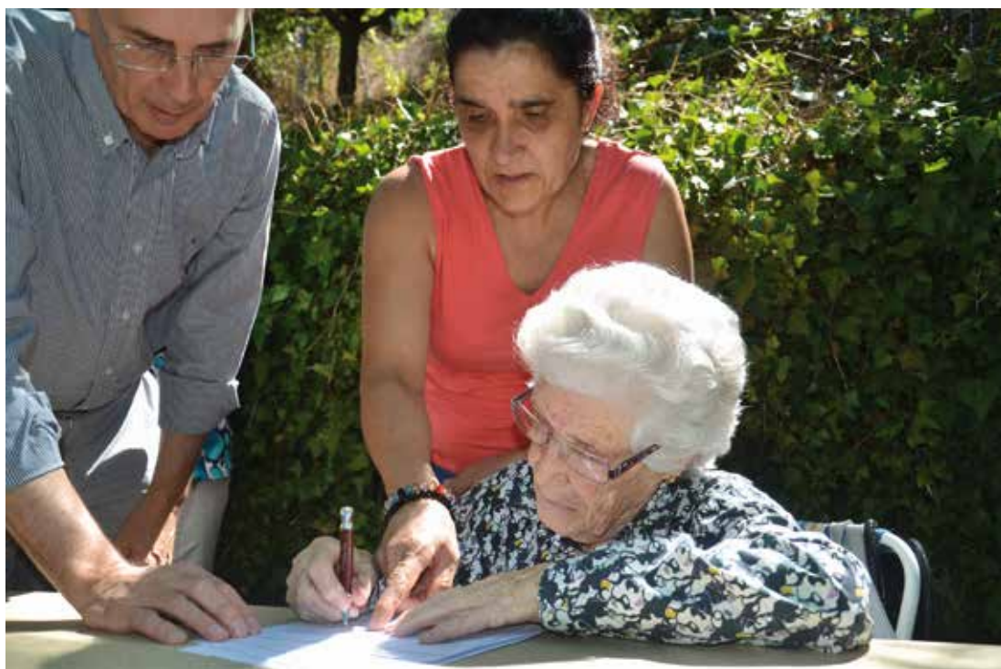
Firma del acta de constitución de la Junta Gestora del monte "Herrería de Oencia" Castropetre (León). Día 8 de agosto de 2012.

trados por este tipo de propiedades, ofreciendo algunas ventajas como son la legitimación de las actuaciones de gestión sobre el monte, la simplicidad en el funcionamiento interno de la entidad a la que se encomienda la gestión, la facilidad para adoptar acuerdos válidos entre los copropietarios al resultar legalmente admitidas las decisiones adoptadas por la mayoría de cuotas, y la capacidad para representar al grupo de propietarios frente a terceros.