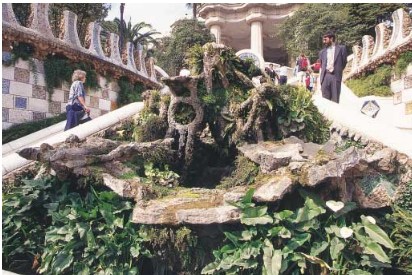
■ Pasear por el Park Güell y recorrer sus innumerables recovecos ayuda a penetrar en el mundo imaginativo de Gaudí.