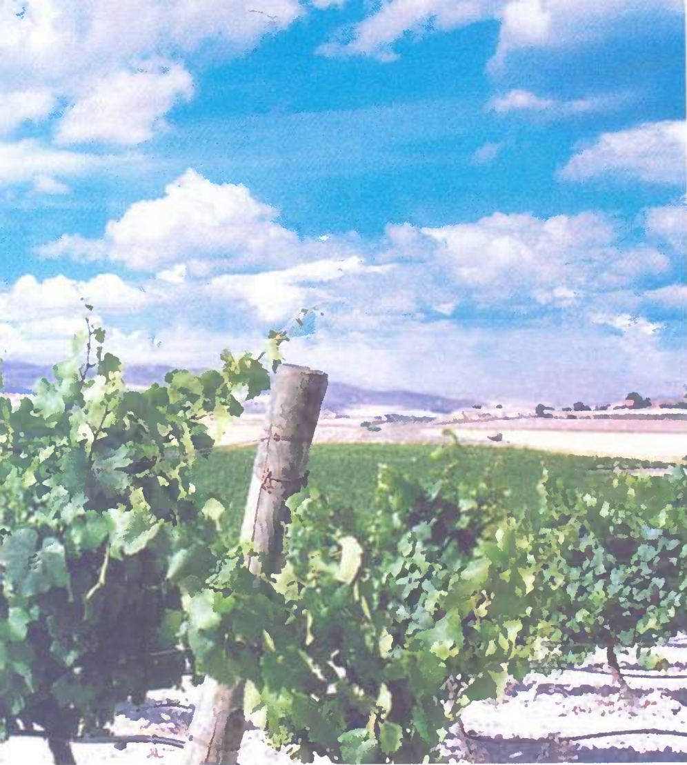
■ Viñedos del Vinalopó.