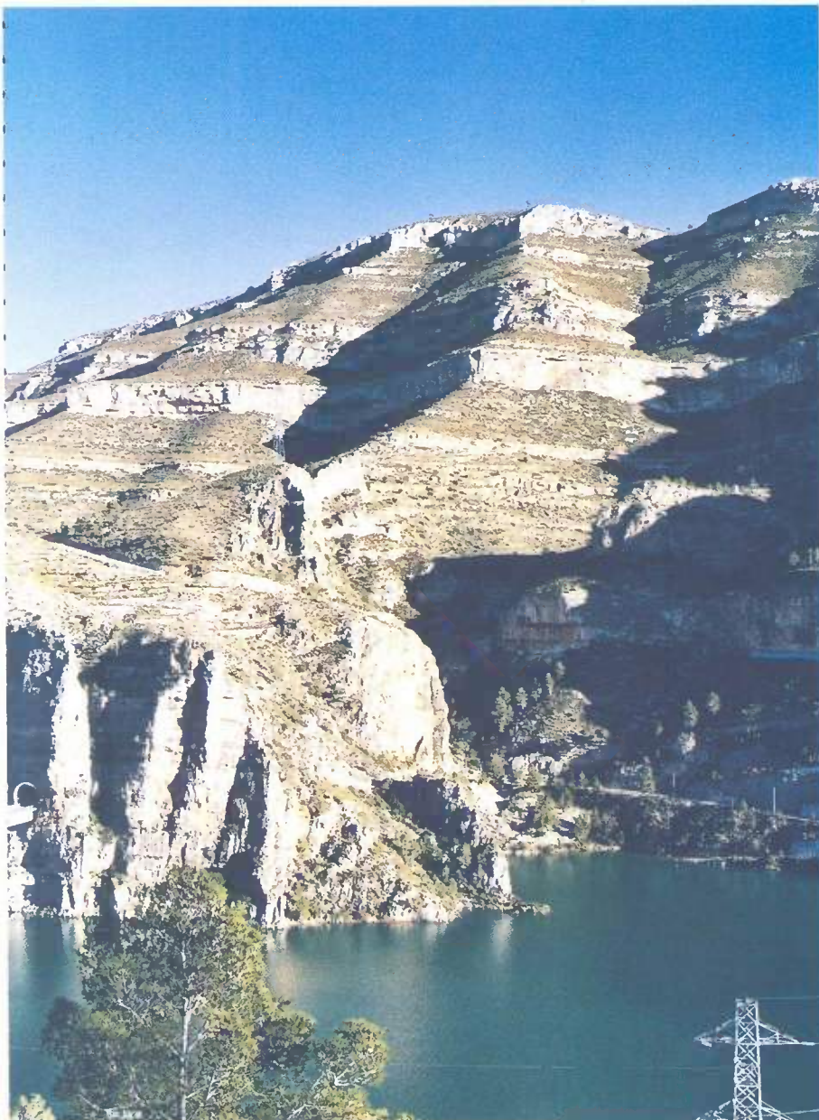
■ Río Júcar.

el Certificado de no afección a la Red Natura 2000 emitido por la Dirección General de Conservación de la Naturaleza del Ministerio de Medio Ambiente, y, como no podía ser de otra forma, con la preceptiva Declaración de Impacto Ambiental, que considera el proyecto respetuoso con el entorno.