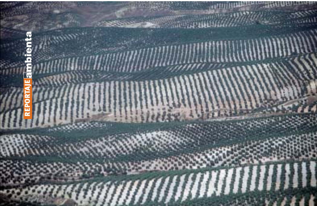
Los subsidios para la agricultura deberán tener en consideración el uso sostenible de la biodiversidad.

La Conferencia Ministerial "Medio Ambiente para Europa", celebrada en Kiev ha sido el escenario de aprobación de varios Protocolos que elevan el nivel de protección medioambiental en contextos transfronterizos