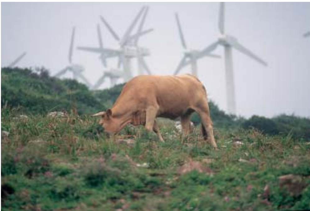
La Unión Europea ha asumido el papel de liderazgo en la consecución del desarrollo sostenible.

En Kiev se ha afianzado el papel de liderazgo que ha asumido la Unión Europea en la promoción del desarrollo sostenible en la región, en un momento en que la UE está en proceso de ampliación y los nuevos socios se preparan para asumir este reto