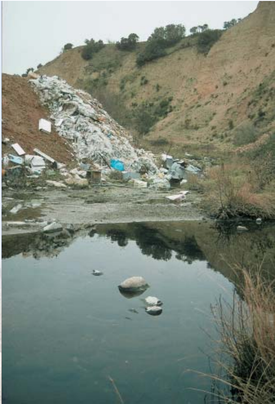
Los datos de los registros de contaminantes servirán para identificar puntos calientes.