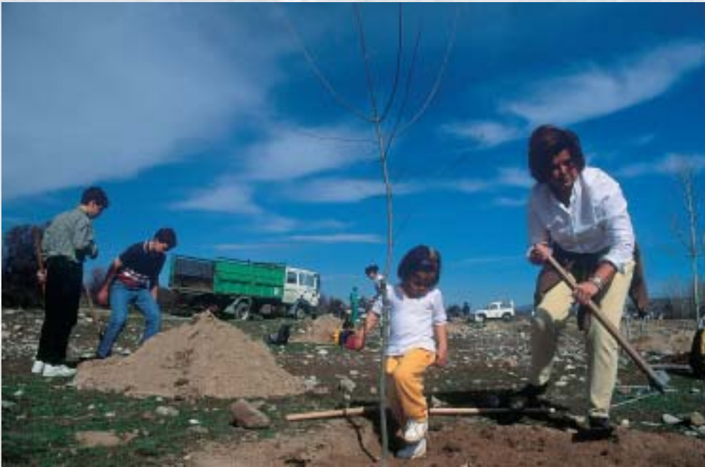
Se trata de lograr un desarrollo medioambientalmente sostenible que proteja la salud de las actuales y futuras generaciones. Reforestación.

En cuanto a las acciones de participación y concienciación, se planteó que antes de 2008, al menos la mitad de los países de la región llevaran a cabo planes de acción en educación y concienciación para informar sobre las políticas de biodiversidad y paisaje e incrementaran la participación de asociaciones, autóctonos y comunidades locales en su implementación.