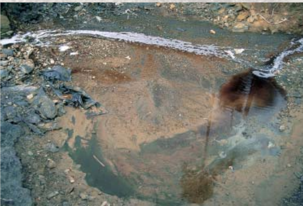
Es necesario minimizar los residuos generados por la industria.

En él, las partes que lo han firmado —entre ellas, España— reconocen la necesidad urgente de elaborar