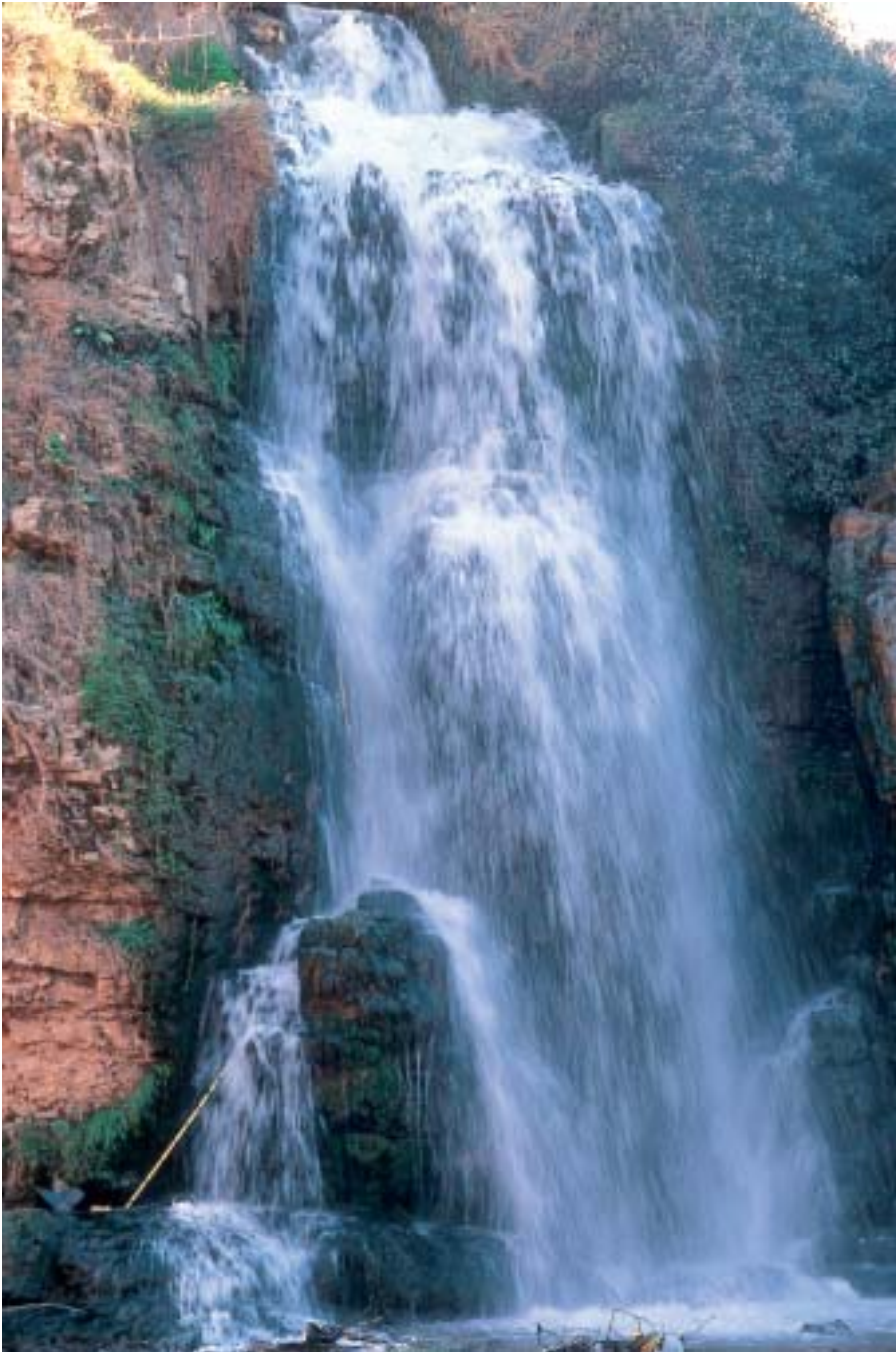
El agua es el principal factor limitante para el desarrollo de muchos países.

El cuarto es el apoyo a importantes instrumentos adoptados en anteriores Conferencias Ministeriales desarrollados en el marco de la Comisión Económica de las Naciones Unidas para Europa (CEPE), como la Estrategia Pan-Europea sobre Paisaje y Biodiversidad y la Estrategia para la eliminación de las gasolinas con plomo. Además, se respaldó la adop-