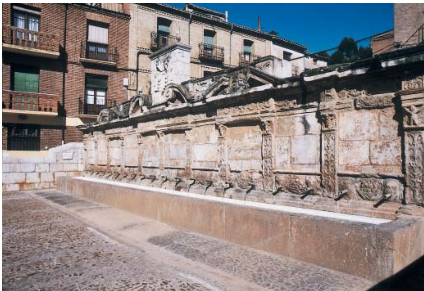
La construcción del embalse permitirá garantizar el abastecimiento a 34 municipios de Teruel y Zaragoza. Fuente de los Veinte Caños. Daroca.

Por otro lado, la construcción de la presa se complementa con una serie de medidas de restitución territorial que tienen como objetivo ofrecer alternativas a los habitantes de las zonas en las que se desarrolla el proyecto. Medidas que parten de las peticiones que ciudadanos y asociaciones locales han hecho llegar a la Confederación Hidrográfica del Ebro. Precisamente el organismo de cuenca última en la actualidad la valoración de estas propuestas que abarcan un amplio abanico de aspectos, desde iniciativas medioambientales, culturales o socioeconómicas hasta proyectos de infraestructuras urbanas, o de usos turísticos del embalse.