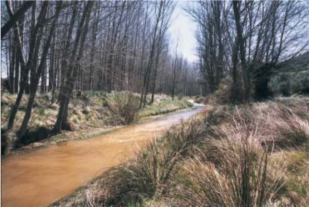
La presa se construirá sobre el río Pancrudo.