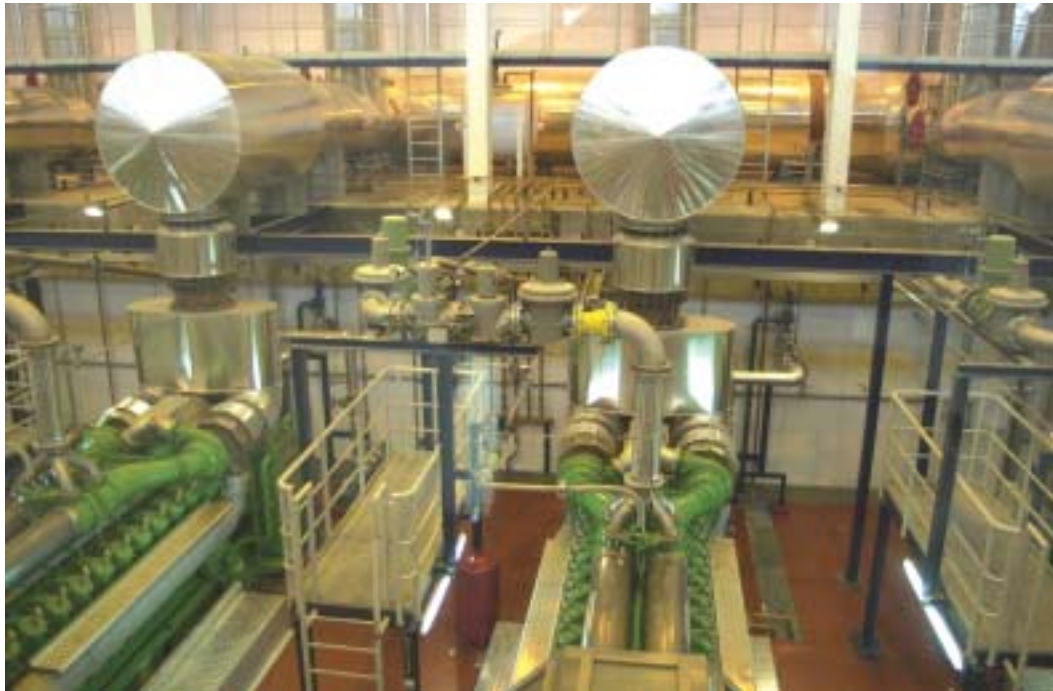
Se han instalado 10 estaciones de regulación y medida automática.

Sobre los terrenos anejos al antiguo vertedero, en los que se ubican sus instalaciones complementarias, se ha creado un parque temático de siete hectáreas de extensión, adyacente a los edificios e integrado en el entorno. Las plantaciones están constituidas por especies adecuadas para so-