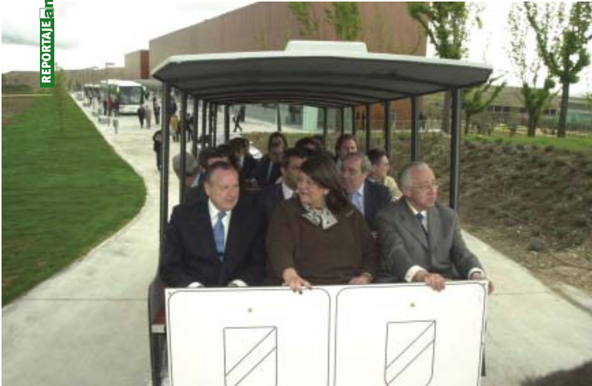
Un pequeño tren permitirá a los visitantes recorrer cómodamente todo el Parque Forestal.

Parque Temático de 7 ha, situado en una zona adyacente al antiguo vertedero, junto al Centro Tecnológico Medioambiental, creado sobre las antiguas instalaciones.