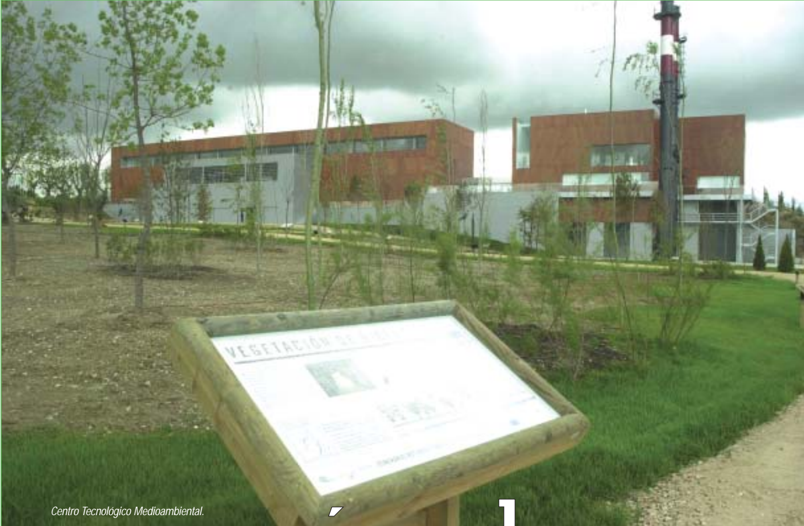
Centro Tecnológico Medioambiental.