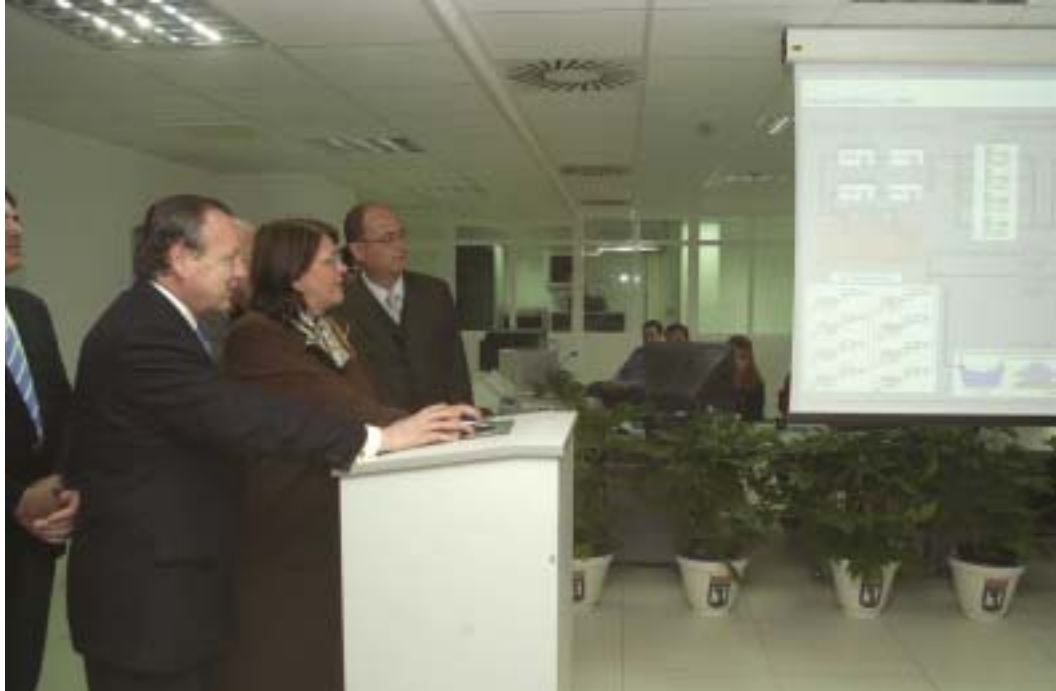
La Ministra de Medio Ambiente y Álvarez del Manzano ponen en marcha el proceso de desgaseificación.

La producción total de energía eléctrica a lo largo de todos los años que dura el proyecto será de 1.145 mi-