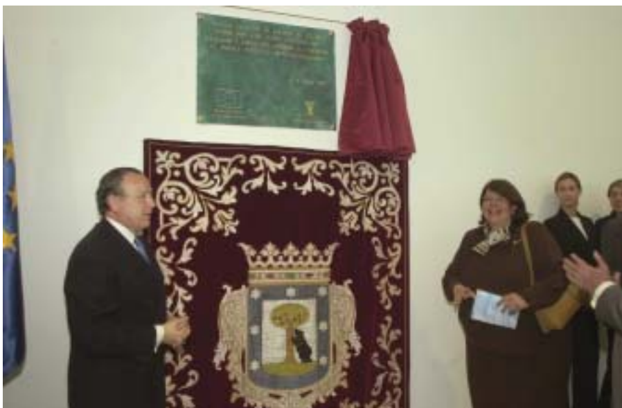
La Ministra de Medio Ambiente y el entonces alcalde Álvarez del Manzano en el acto de inauguración del Parque Forestal de Valdemingómez.

Con el gas que se extraiga del antiguo vertedero sellado se producirá energía eléctrica suficiente para cubrir el 75 por ciento del consumo anual del alumbrado público municipal