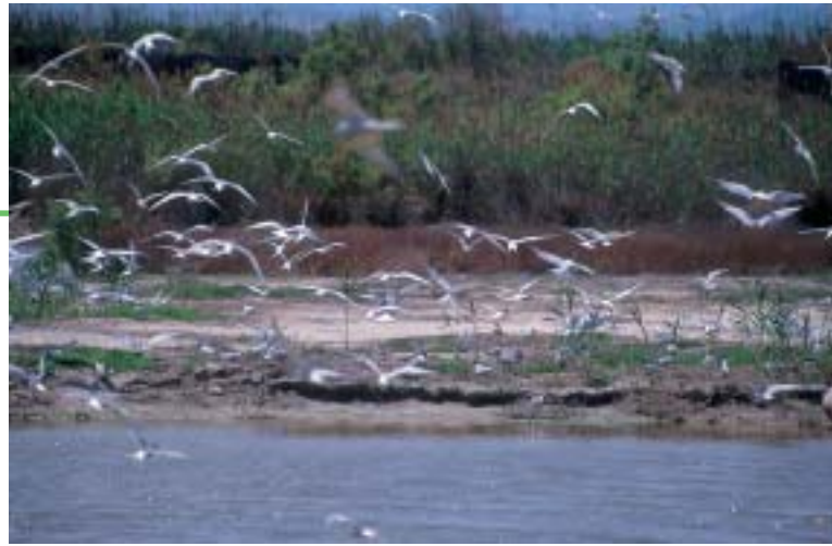
Colonia de cría de charranes.

rente se inundan más de 14.000 hectáreas de arrozal. Pero no todas se han adaptado tan bien, algunas especies de aves desaparecieron o se han rarefocado. Este es el caso de una gallinácea tan abundante como la focha común, que pasó de contarse por millares a hacerlo por decenas, o del fumarel cariblanco que un buen día dejó de nidificar. También hay ejemplos esperanzadores como el del calamón, que volvió a este espacio después de haberse extinguido durante años. Si el indicador de futuro es el fumarel o el calamón es algo que depende de los cuidados que seamos capaces de procurarle a esta joya litoral. 🌿