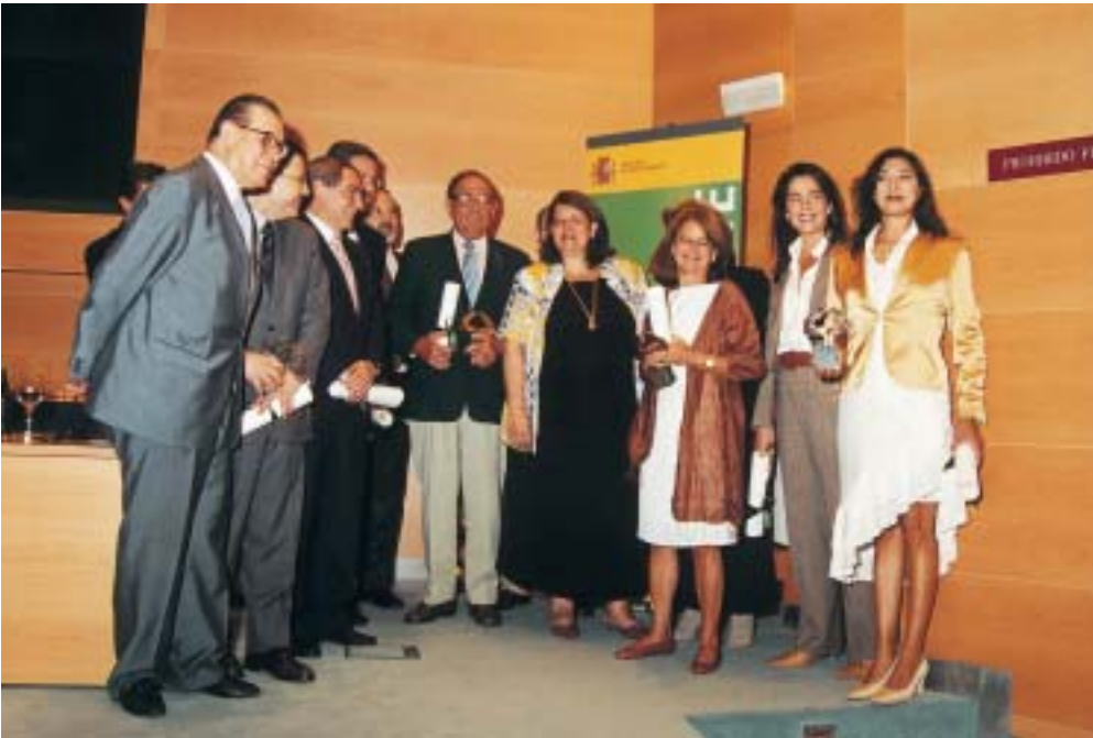
Todos los galardonados con los Premios Nacionales de Medio Ambiente 2003 junto a la Ministra Elvira Rodríguez.