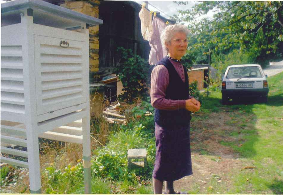
La mayor parte de los voluntarios vive en zonas rurales alejadas de los núcleos urbanos.

la exactitud de complicados modelos informáticos que se usan para simular el clima pasado y reciente y hacer proyecciones futuras.