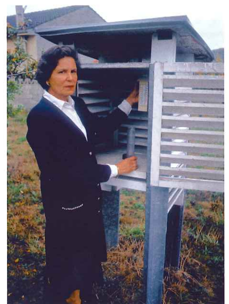
La tarea de estos observadores voluntarios es ayudar a completar con sus anotaciones los datos obtenidos por el INM.

La continuidad en el tiempo de este tipo de observaciones tiene un valor crucial. Muchas veces la única forma de comprender el cambio y las variaciones del clima consiste en recurrir a reseñas históricas, logradas a partir de datos recabados durante más de un siglo. A esto cabe añadir que esta información también sirve para probar