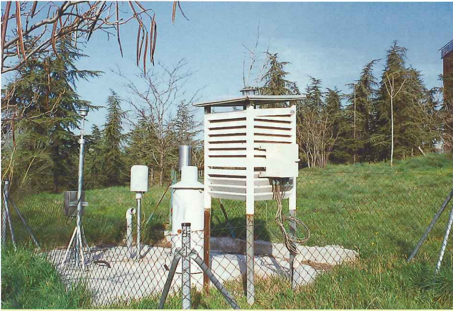
Los colaboradores manejan con soltura el termómetro, pluviómetro, heliógrafo...

Sor Isabel es una más de las 4.000 personas que prestan su apoyo de forma altruista en España al INM. Están repartidas por todo el país, ejercen muy distintas profesiones, y, curiosamente, la inmensa mayoría de ellas carece de conocimientos específicos de climatología. Sin embargo, esto no supone ningún impedimento a la hora