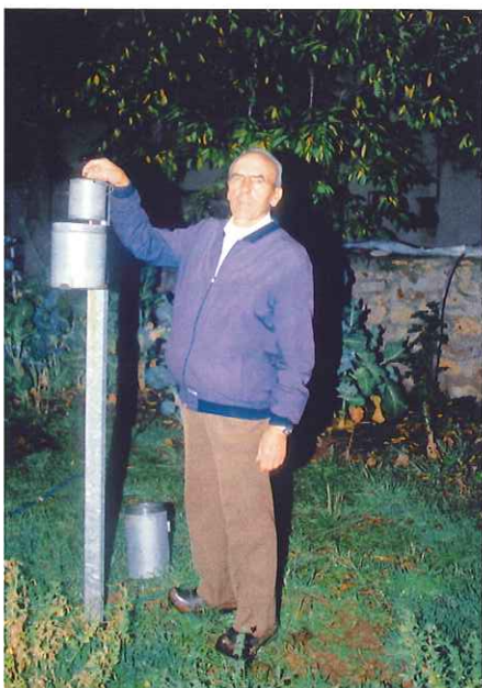
Todos los días del año, a primeras horas de la mañana, los voluntarios anotan las variaciones meteorológicas.

El clima no entiende de fronteras y, en consecuencia, los voluntarios existen a escala mundial. Con independencia del país en que se encuentren, todos ellos comparten dos características: la perseverancia y el compromiso. Como paradigma de este sentido de la responsabilidad cabe citar el caso de un hombre de noventa y cuatro años que