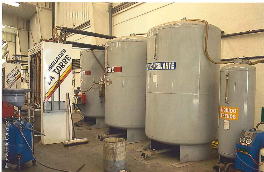
Los aceites, fluidos refrigerantes, carburantes... son regenerables y pueden ser valorizados energéticamente.

residuos no peligrosos, como plásticos, neumáticos, vidrio, cables, piezas de aluminio, baños de zinc, fibras, llanta, chapa, componentes del motor, etc., todos ellos reutilizables o reciclables. Y lo mismo ocurre con otros, que sí son peligrosos, como los aceites, filtros de aceite, baterías, fluidos refrigerantes y carburantes, que son regenerables y pueden ser valorizados energéticamente, o bien ser refundidos para obtener plomo y plástico o descontaminados y neutralizados para su posterior reutilización.