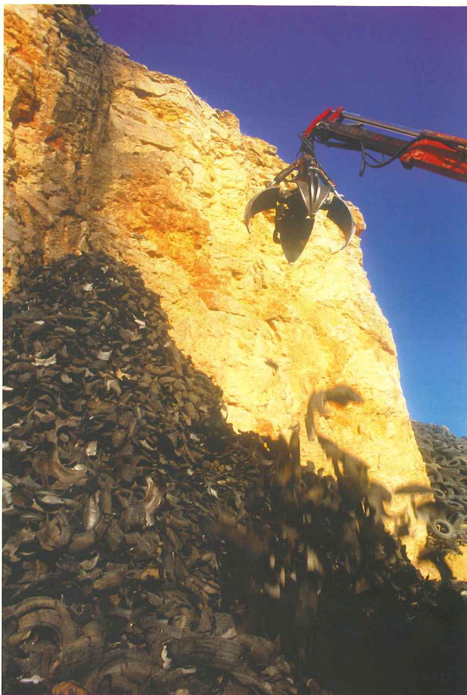
Los neumáticos son reutilizables para firmes de carreteras, calzados o incluso combustibles.

Igualmente se establecen plazos concretos para el cumplimiento de diferentes objetivos: recogida y valorización a través de los CARD de, al menos, el 80 por ciento de VFU en el año 2002 y de su totalidad en 2006; reutilización y valorización de, al menos, el 85 por ciento en peso de los VFU (su peso medio es de unos 800 kilogramos) antes del 2005, aunque