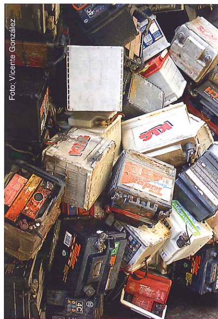
Algunos componentes de los vehículos están calificados como "peligrosos".

Esto supone que en ese período se generarán entre 594.000 y 795.000 toneladas de chatarra y piezas férricas;