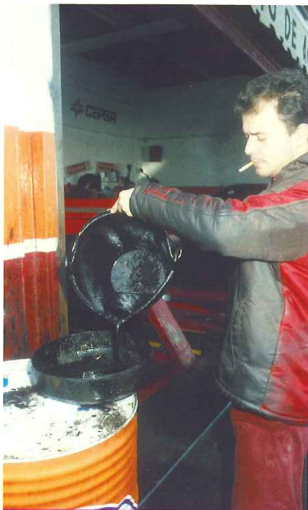
Durante la duración del Plan se calcula que se generarán aproximadamente 11.000 toneladas de aceites y grasas.

Su ubicación, al menos una por provincia, será decidida por las comunidades autónomas y entes locales, lo mismo que una red paralela de centros de fragmentación, donde una vez descontaminado el vehículo se divide y trocea para enviar cada material para que sea reciclado por el gestor correspondiente.