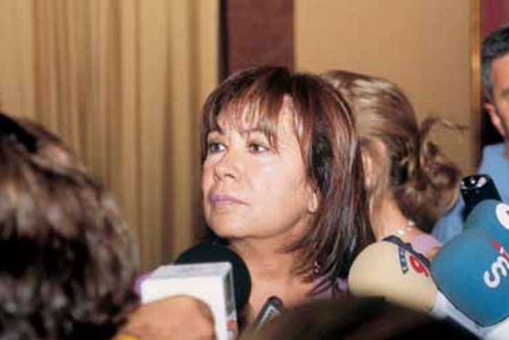
La ministra de Medio Ambiente, Cristina Narbona, atendió a los medios de comunicación durante las dos reuniones del CAMA.

medidas destinadas a prevenir con mayor eficacia los incendios forestales, que corresponden tanto a las administraciones ambientales como al resto de Ministerios y Consejerías. Entre ellas, cabe destacar el reforzamiento de la prevención activa, la optimización de los métodos y sistemas de extinción y su coordinación, el impulso de la participación de la sociedad y la mejora de la investigación de las causas y la persecución del delito.