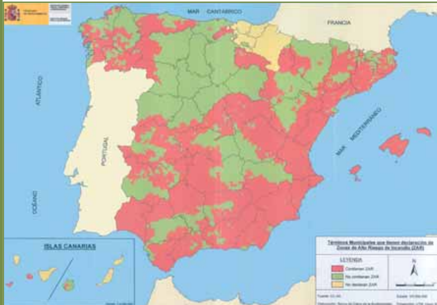
Zonas de alto riesgo de incendio (ZAR)

Durante dos sesiones celebradas los días 20 y 24 de octubre, se reunió, bajo la presidencia de la ministra de Medio Ambiente, Cristina Narbona, el Consejo Asesor de Medio Ambiente (CAMA). En estas dos jornadas se expusieron y debatieron diferentes temas: un balance de incendios forestales, el Proyecto de Presupuestos del Ministerio de Medio Ambiente para 2006, el balance del año hidrológico, el Proyecto de Real Decreto sobre el régimen económico y de compensaciones del Parque Nacional de Picos de Europa, así como otros textos normativos.