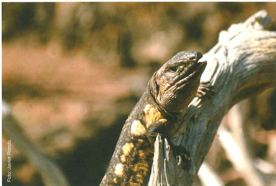
■ Lagarto gigante de El Hierro.

España, en cumplimiento de dicho Convenio se comprometió a elaborar