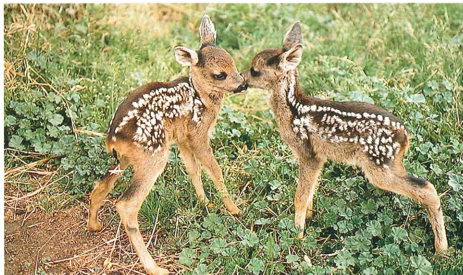
■ Corzos jóvenes.

La Fundación Biodiversidad se constituye según Orden Ministerial de 23 de noviembre de 1998. Forman su Patronato, como miembros permanentes: el Ministerio de Medio Ambiente, la Oficina Española de Patentes y Marcas, la Agencia Española de Cooperación Internacional y el Organismo Autónomo Parques Nacionales.