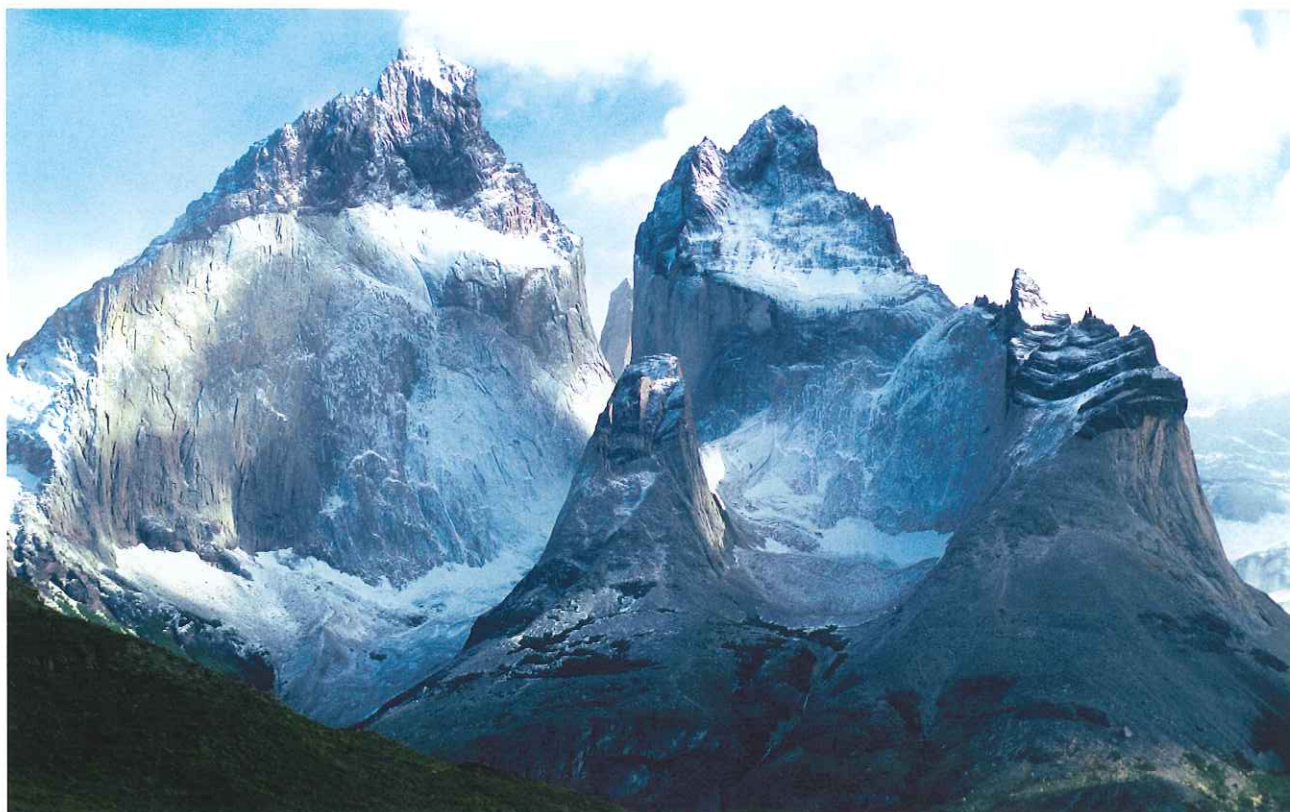
■ Cuernos del Paine. Parque Nacional Torres del Paine. Los Andes. Chile.

Hasta entonces existían importantes iniciativas de cooperación. Por ejemplo, la Red Latinoamericana de Áreas Protegidas y Parques Nacionales, desarrollada en el marco de la FAO o mediante los acuerdos alcanzados a través de la Comisión Mundial de Áreas Protegidas de la Unión Internacional para la Conservación de la Naturaleza, pero no existía una red que englobará, a los países latinoamericanos, junto a España y Portugal.