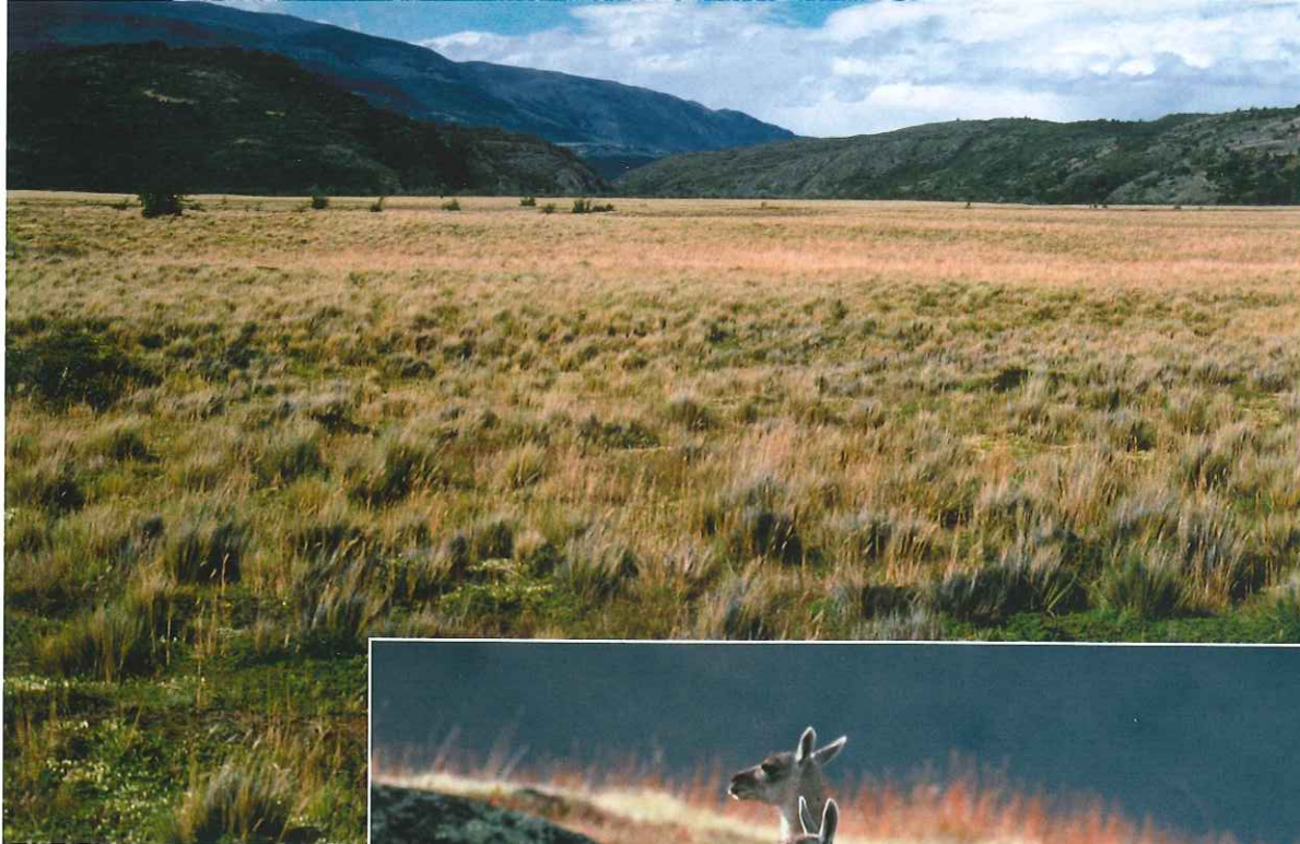
■ Estepa patagónica. Chile.