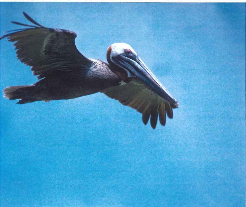
■ Pelicanos ( Pelicanus occidentales ). Parque Nacional Los Roques. Isla de Selesquí. Venezuela

E l objetivo principal del II Encuentro Iberoamericano de Parques Nacionales y Áreas Protegidas consistió en sentar las bases para la creación de una Red iberoamericana de cooperación en materia de gestión de espacios naturales. La creación de esta red es de suma importancia, porque fomentará la puesta en común de las experiencias de todos los países lo que permitirá un intercambio de conocimientos que, sin duda, contribuirá a una mejor gestión de los Parques Nacionales y otras áreas protegidas.