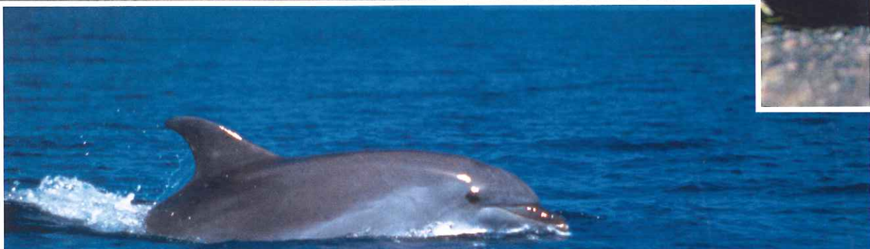
Texto: Maribel del Álamo

Los países iberoamericanos dibujan, entre todos, una inmensa red de espacios protegidos que reúne una variada representación de los ecosistemas existentes en el planeta. Esta red, hasta hace semanas inconexa, ha tomado forma gracias al acuerdo suscrito en el Encuentro celebrado en Cartagena de Indias. A partir de ahora, la conservación de la biodiversidad de los Parques Nacionales y otros espacios protegidos, será una tarea común con intercambio de propuestas, iniciativas y experiencias.