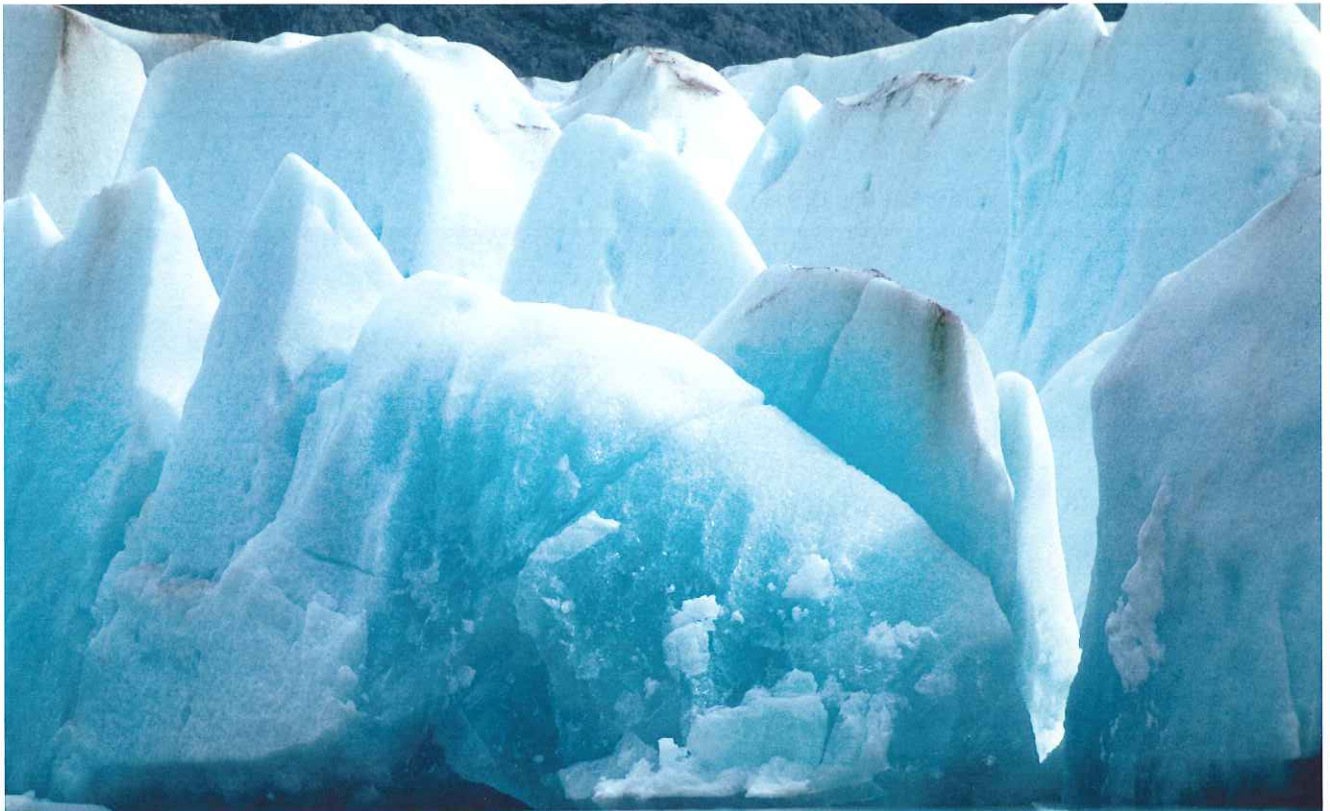
■ Glaciar Grey. Parque Nacional Torres del Paine. Chile.

firmantes, y las diferencias en cuanto a los medios disponibles, se trató también en Cartagena de Indias la importancia de contar con personal suficiente en número y capacitación profesional para atender a las necesidades de los parques nacionales y otras áreas protegidas. Algunos países cuentan con presupuestos estatales que garantizan esta capacitación y estabilidad del personal, pero hay muchos que carecen de estas posibilidades. Por