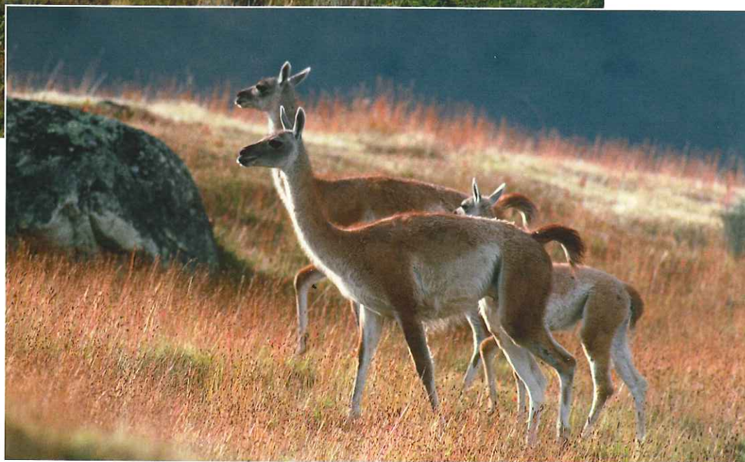
■ Guanacos ( Lama guanicoe ). Parque Nacional de Torres del Paine. Chile.