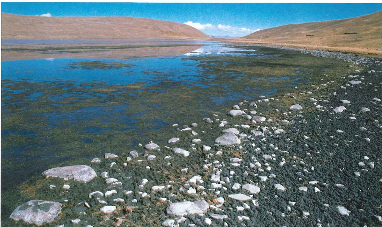
■ Lago Cañouma. Localidad Ulla Ulla. Bolivia.