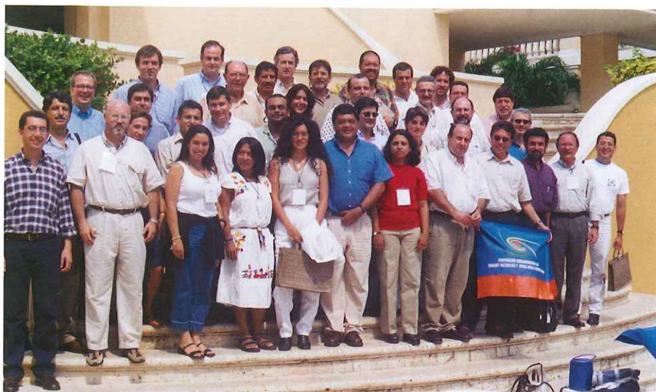
2do. ENCUENTRO MULTILATERAL PARA EL DESARROLLO DE LA CORPORACIÓN EN PARQUES NACIONALES Y OTRAS ÁREAS PROTEGIDAS. (Nov. 5 al 11/2001)