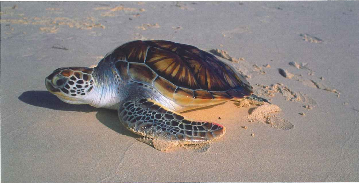
■ Tortuga ( Laud Chelonia mydas ). Parque Nacional Los Roques. Isla Dosmosquines Sur. Venezuela.