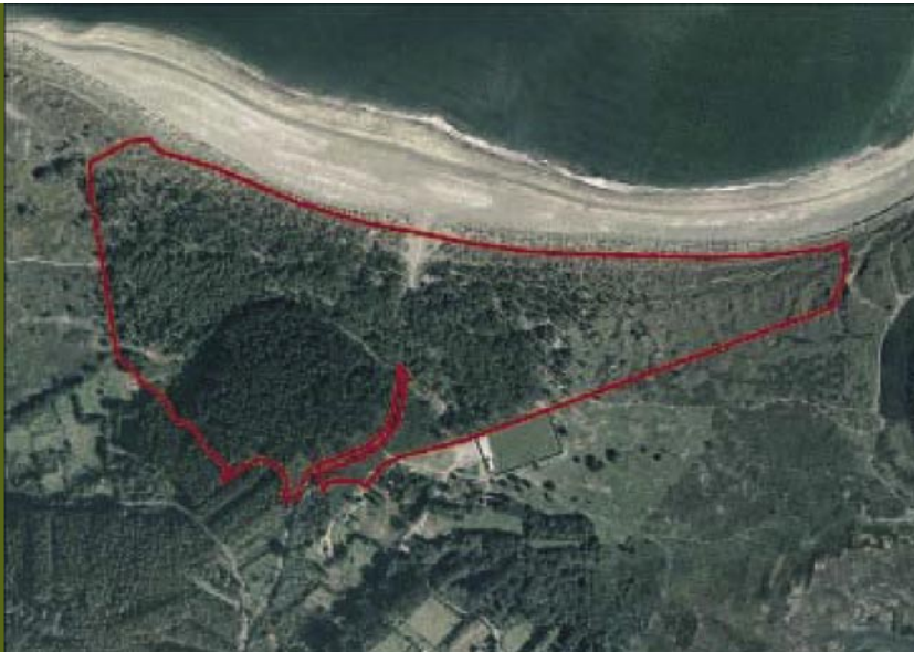
Finca en la playa Morouzos. Ortigueira. A Coruña