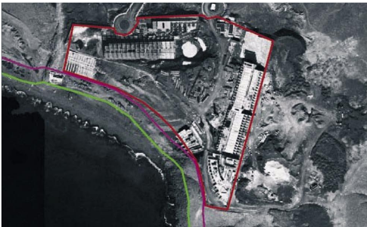
Finca del hotel Papagayo Arenas. Yaiza. Lanzarote

Por otra parte, la finca dispone de un alto valor geológico siendo igualmente excepcionales las es-