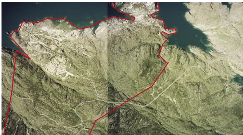
Cabo de Creus

Para la puesta en marcha del Programa de Adquisición de Fincas, se ha seguido el siguiente proceso: