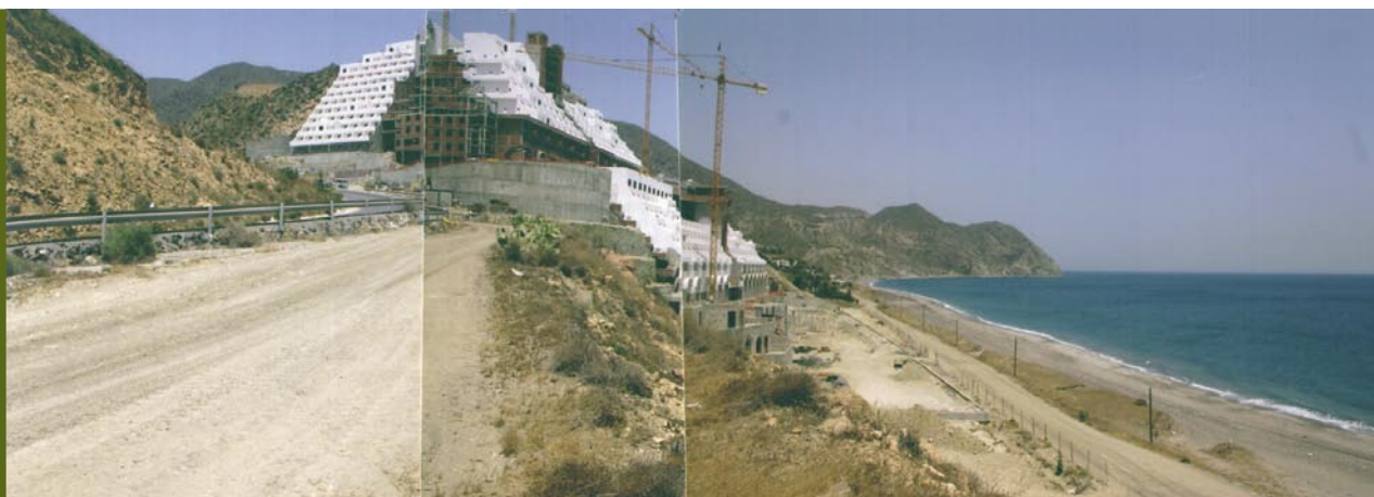
Finca en la que se construye un hotel en el Paraje de Algarrobico. Carboneras. Almería

La base de datos generada, se concibe como una base de datos abierta en la que en cualquier