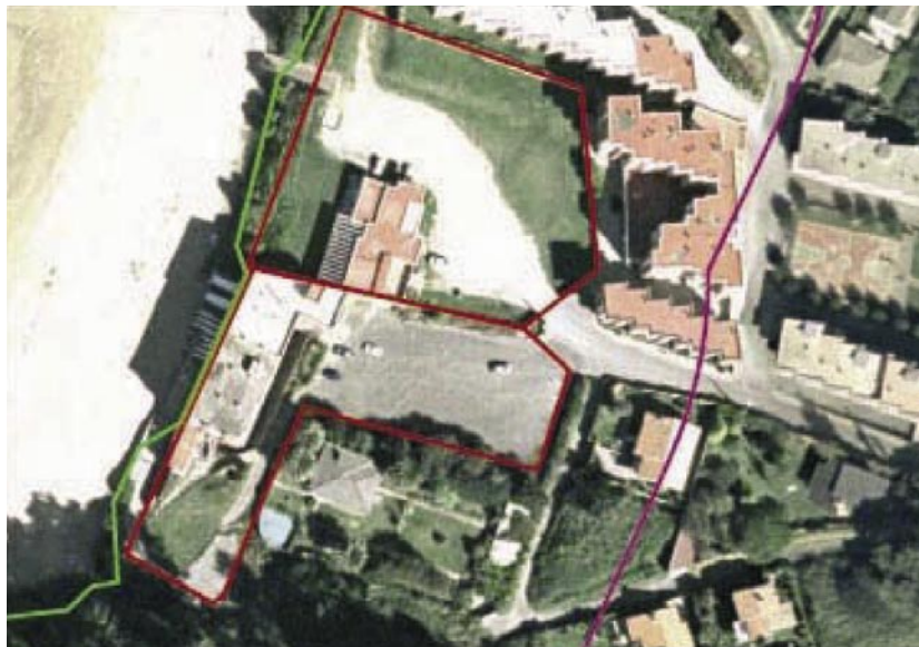
Construcciones en la playa de Ber. Pontedeume. A Coruña

Dentro del Programa de Adquisición de Fincas, la Dirección General de Costas ha expropiado la finca y las construcciones ubicadas en el Cabo de Creus que pertenecían al Club Mediterráneo S.A, por estimarse necesarios para la defensa y el uso del Dominio Público marítimo-terrestre y dado que la Ley 4/1998 de 12 de marzo del Cabo de Creus, aprobada por el Parlamento de Cataluña, declaró Parque Natural la península del Cabo de Creus dentro de la cual delimitaba