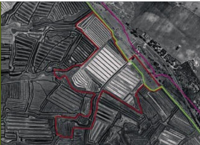
San José de Pinar. Puerto Real. Cádiz

pecies florísticas, formaciones botánicas y patrimonio faunístico que se encuentran en la misma.