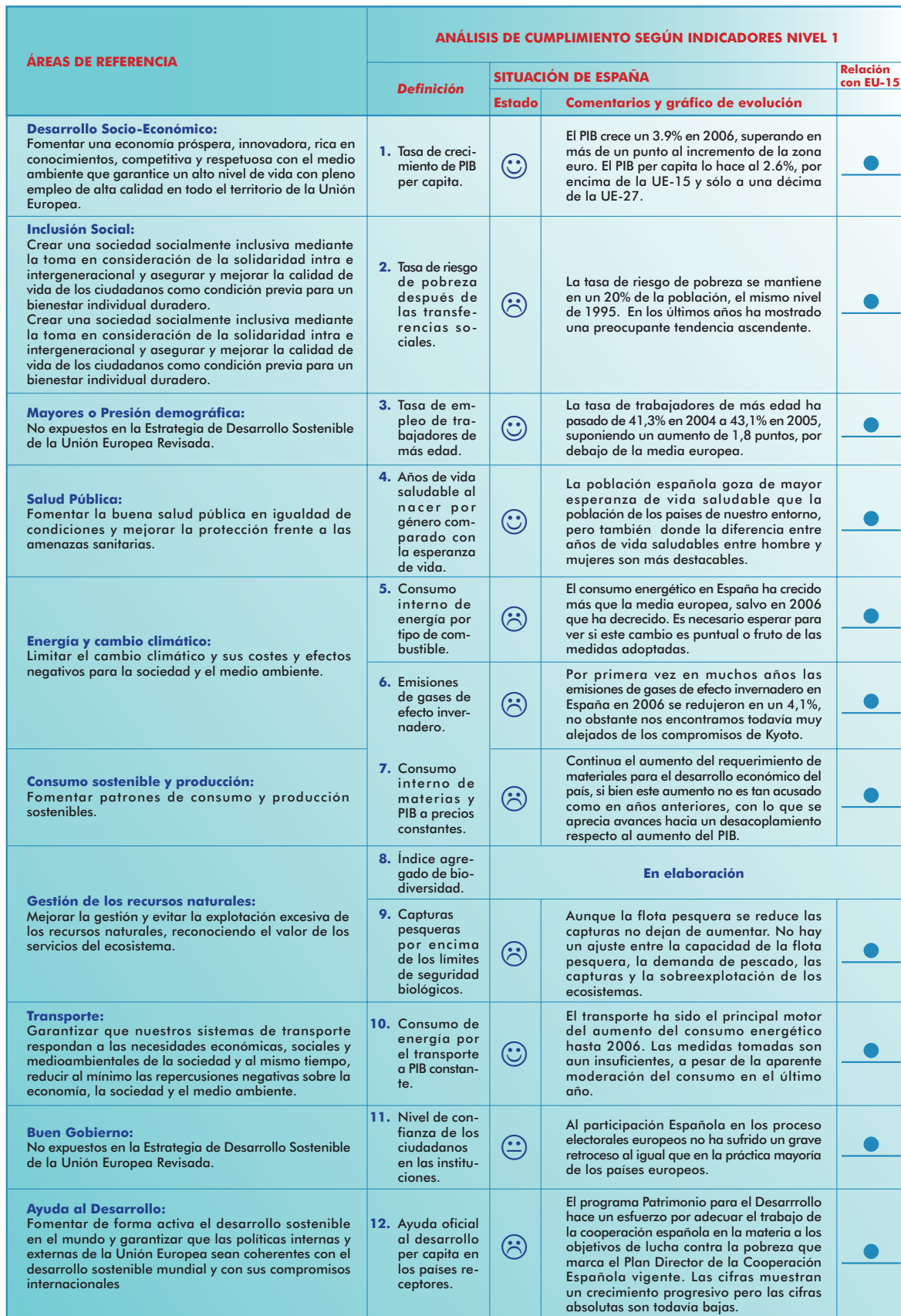
Tabla 1: indicadores principales de la Estrategia de Desarrollo Sostenible Europea Fuente: Elaboración propia OSE 2006 y 2007 (en elaboración)