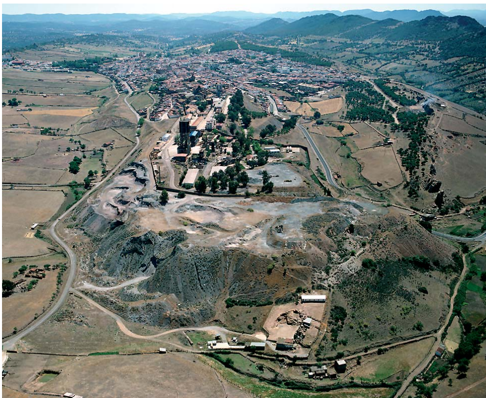
La escombrera del Cerco de San Teodoro en mayo de 2005.