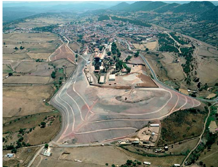
Junio de 2006.