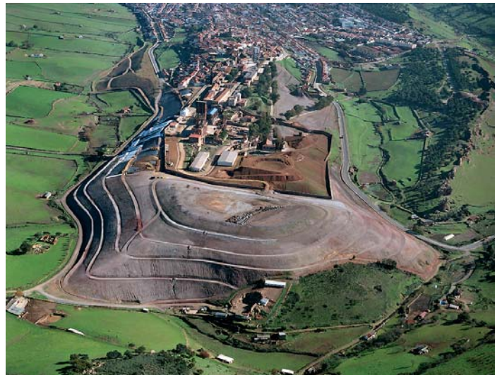
Diciembre de 2006.