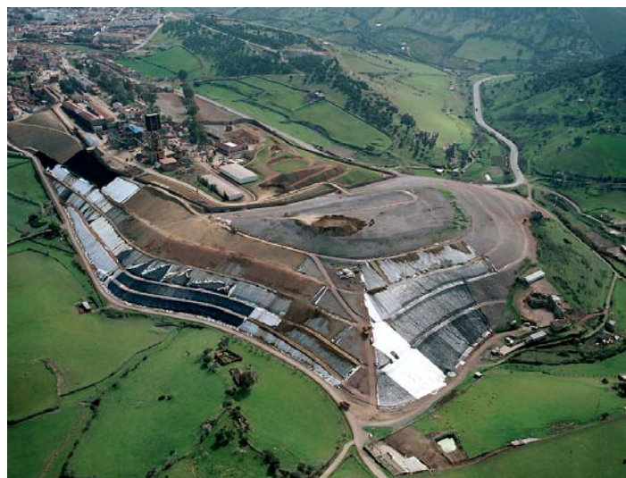
Marzo de 2007.