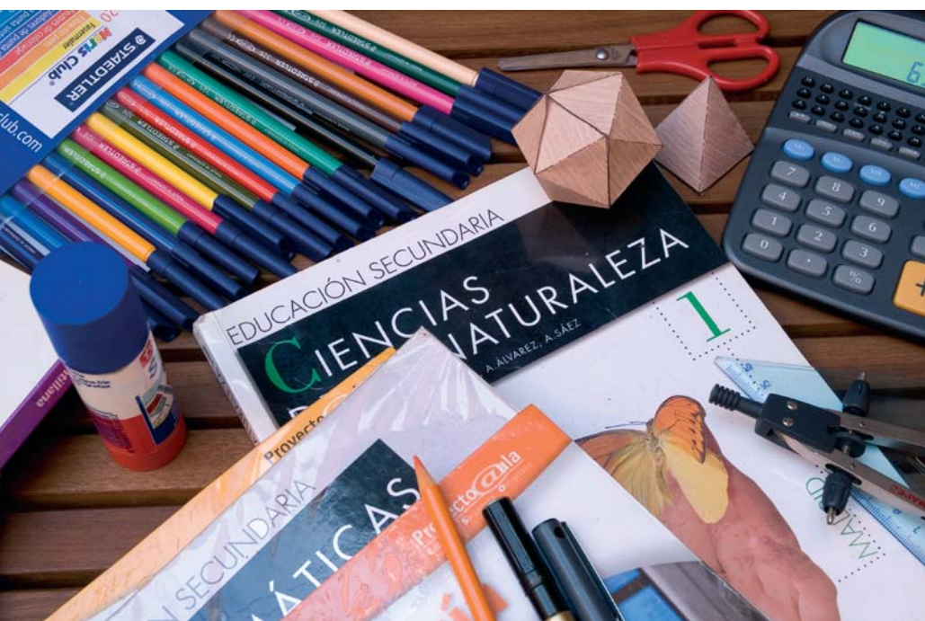
Los textos escolares pueden tener un papel decisivo en la necesaria revisión cultural.

medios necesarios para satisfacer las necesidades humanas” 11 . “Gracias a los avances técnicos los medios de comunicación nos permiten saber lo que ocurre en otras zonas del planeta, la información y la cultura están al alcance de todos y el interés por mantener el equilibrio ecológico del planeta se ha generalizado entre muchas personas” 12 . En algunos casos la exaltación puede resultar hasta grotesca: “Durante la Guerra del Golfo, los soldados de EEUU y de otros países aliados, pudieron tomar todas sus comidas en las trincheras, calentitas y en cualquier momento, gracias a la tecnología” 13 . Los inconvenientes de la tecnología que se mencionan en ocasiones pueden hasta herir sensibilidades. Veamos por ejemplo esta cita que, ante la aparición de la guerra química durante la I Guerra Mundial, expone como inconveniente la obligación “de empleo de incómodas máscaras antigás ¿Es ésta la principal