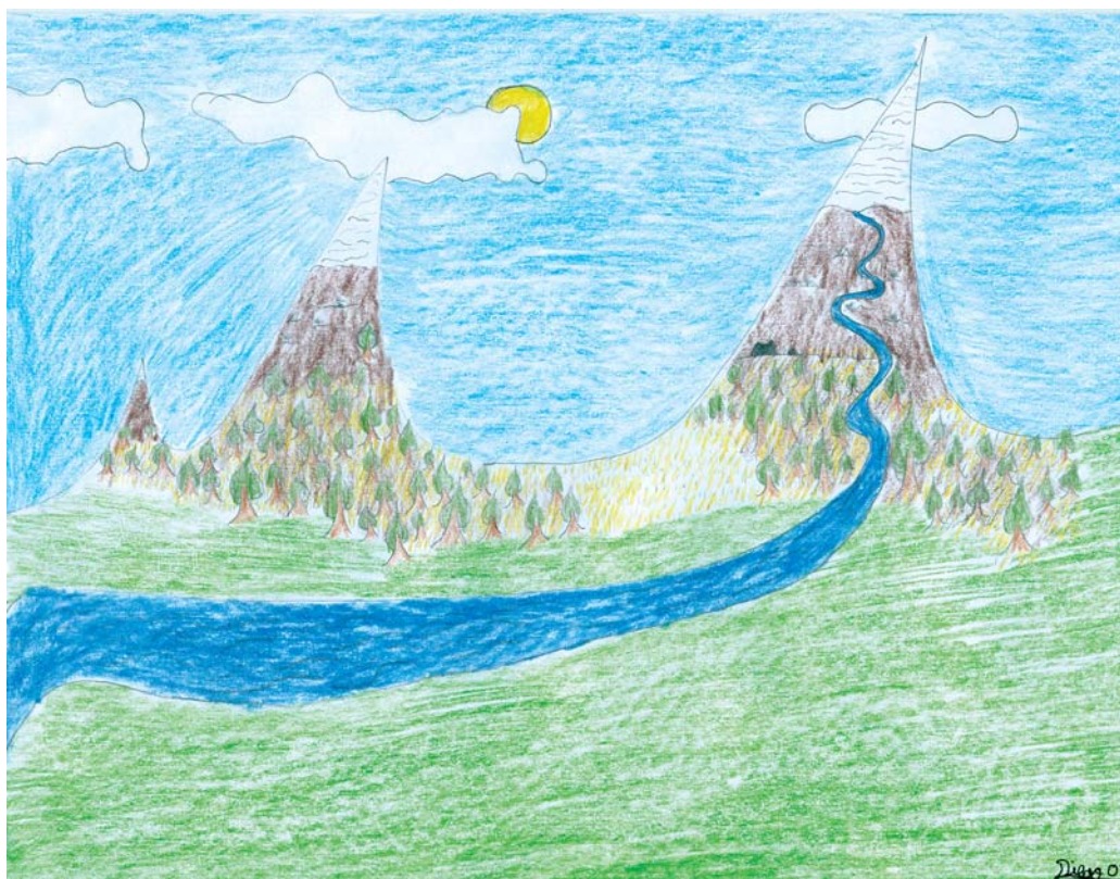
La mayor parte de los escolares no es consciente de la gravedad de la crisis ambiental y de la urgencia de actuar ante ella.

En general, los textos realizan una exaltación incondicional de la tecnología, mientras ignoran la evolución del territorio deteriorado por los impactos (muchos irreversibles) del uso de una buena parte de las tecnologías. La fe tecnológica puede encontrarse en las portadas de los libros, los gráficos, las fotos, los ejercicios y los comentarios de prácticamente todas las materias. Se predicán sistemáticamente los aspectos positivos de la misma y se obvian los negativos. Los textos, como una parte importante de la sociedad misma, apuestan por la tecnología como fórmula para resolver los problemas y la vida (incluso los generados por la propia tecnología), en detrimento, eso sí, de considerar la conservación en el territorio de las condiciones que permiten la vida. “La tecnología se ocupa de aportar los