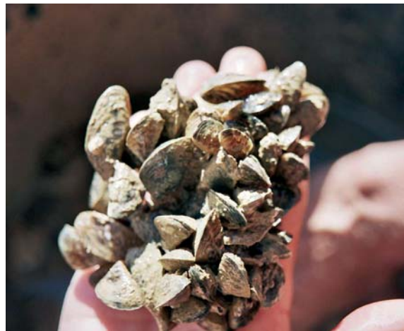
La proliferación del mejillón cebra constituye un ejemplo de la expansión de una especie exótica invasora.

La proliferación del mejillón cebra ( Dreissena polymorpha ), constituye un ejemplo de la expansión de una especie exótica invasora. Originario de los mares Caspio y Negro, este molusco bivalvo tiene un comportamiento fuertemente invasor, y viene