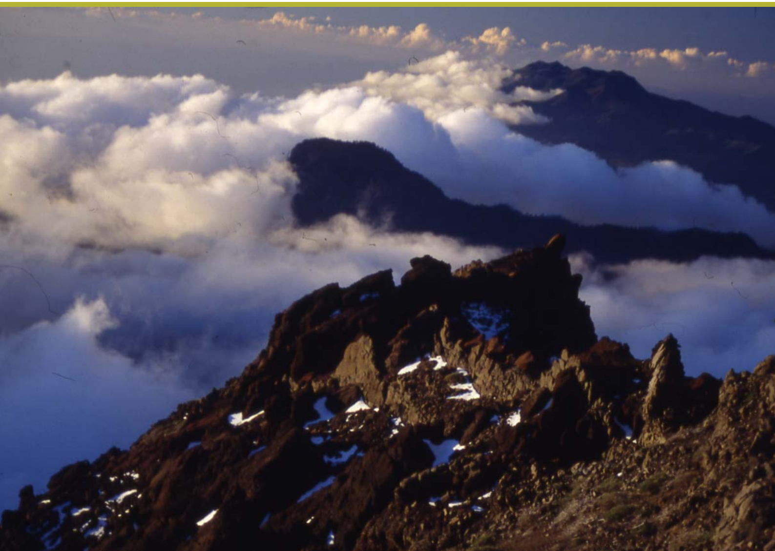
Se aprobaron los compromisos financieros para subvencionar proyectos que promuevan un desarrollo sostenible en las áreas de influencia socioeconómica de los Parques Nacionales. Parque Nacional de la Caldera de Taburiente.

subvencionar proyectos que promuevan un desarrollo sostenible en las áreas de influencia socioeconómica de los Parques Nacionales. La finalidad de las ayudas es la promoción de un desarrollo económico y social compatible con la protección y mejora del medio ambiente y la financiación corresponde al Ministerio de Medio Ambiente, a través del Organismo Autónomo Parques Nacionales. Debido a esto, días después, el Consejo de Ministros en su reunión del 14 de septiembre autorizó la transferencia de 9.857.118 euros a las Comunidades Autónomas con Parques Nacionales en su territorio para financiar los proyectos. A esta cantidad hay que añadir otros 3.351.101 euros de remanentes de años anteriores previamente distribuidos y no comprometidos. Así, en total las Comunidades Autónomas