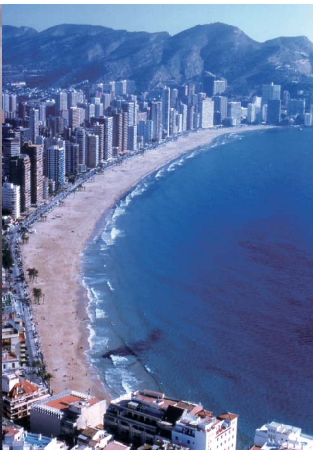
Benidorm en 1960 y en la actualidad.