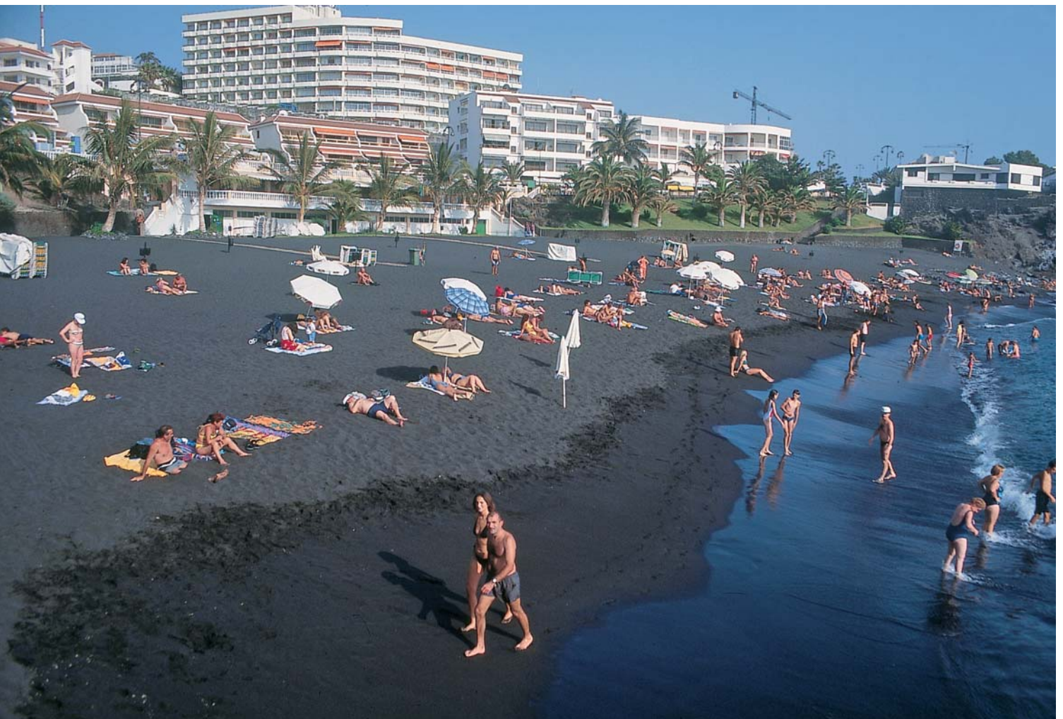
El 80% de los casi 60 millones de turistas que visitan España al año eligen la costa para sus vacaciones.

De hecho, la gran apuesta de la Estrategia es el establecimiento de nuevos modelos de desarrollo en la franja costera. Modelos que no estén basados en la ocupación urbanística de la franja costera sino, al contrario, que se apoyen y potencien el recurso "naturalidad" del litoral y permitan, de este modo, conservar para futuras generaciones lo que nosotros hemos recibido de nuestros ancestros. A tal fin, el diagnóstico realizado ha prestado especial atención al establecimiento de actuaciones estratégicas tendentes a la recuperación de la integridad física y natural de los ecosistemas costeros así como al análisis de terrenos cuyas características aconsejen su adquisición para su posterior integración en el dominio público.