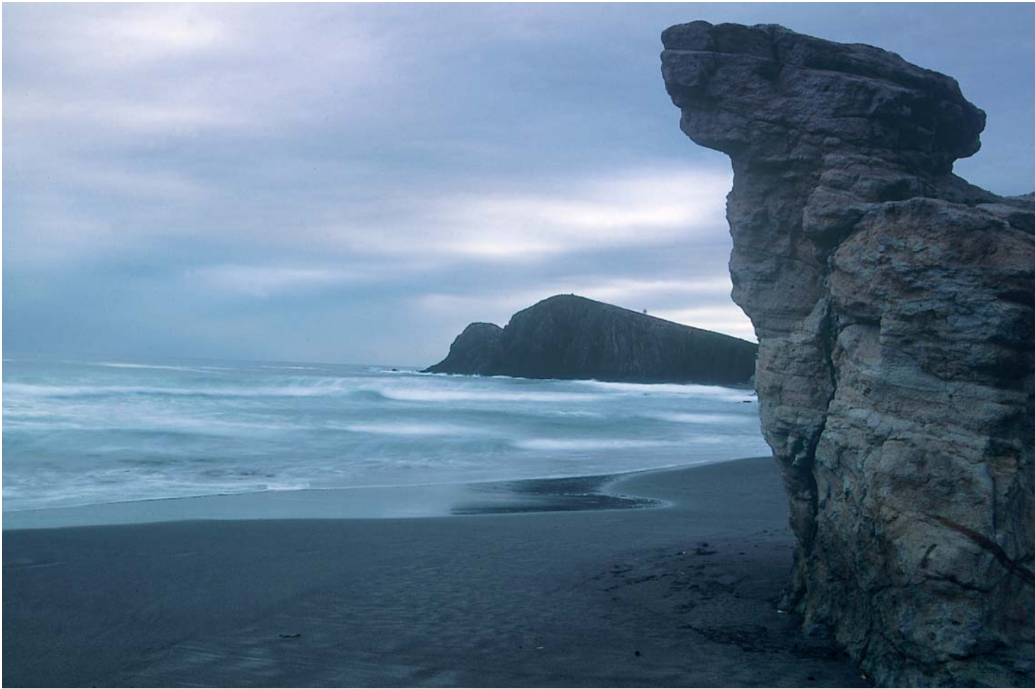
La franja costera española alberga una gran variedad de ambientes climáticos, marinos, geológicos y sedimentarios a lo largo de los más de 8.000 Km. de litoral con los que contamos.

El esfuerzo inversor al que obligarán las actuaciones necesarias para recuperar la franja costera será, también, acorde a la magnitud de los retos a los que nos enfrentamos. Teniendo en cuenta el coste medio de las actuaciones de recirculación de sedimentos y protección de costa que hoy en día se realizan, se estima que la recuperación de la estabilidad física y natural de las playas del Mediterráneo tendría un coste aproximado de unos 5.000 millones de euros. Cifra muy significativa pero que apenas representa un 3% de los ingresos que se generan en el turismo costero anualmente, sector que representa del orden del 10% del PIB nacional.