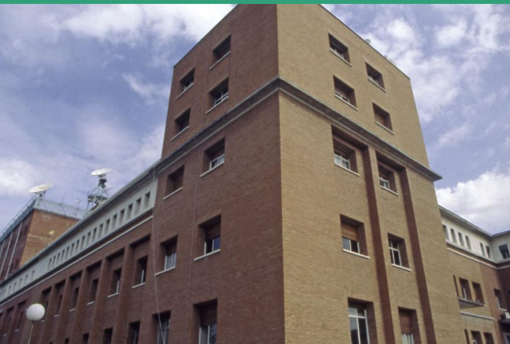
La Agencia ha de ser referencia básica de la meteorología española ante los nuevos retos climáticos y ambientales. Edificio de la AEMET.

da a la nueva Agencia. Seis son las líneas básicas que se establecen a este respecto: