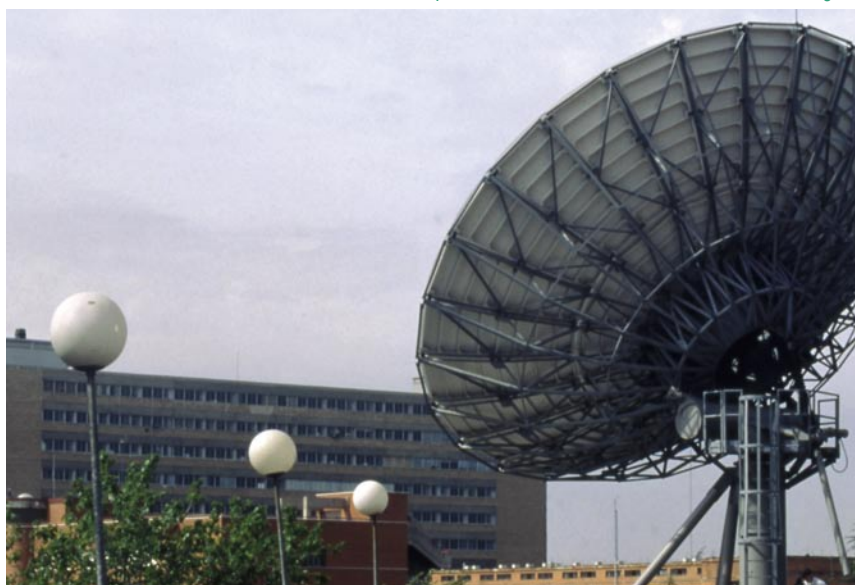
La AEMET se plantea la mejora continuada de la eficiencia en la prestación de los servicios mediante el perfeccionamiento de la infraestructura tecnológica.