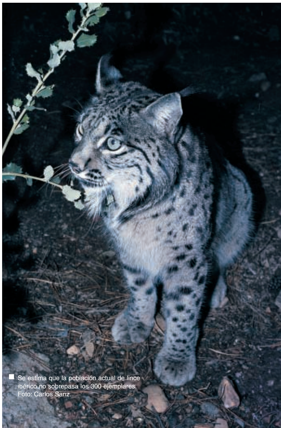
■ Se estima que la población actual de lince ibérico no sobrepasa los 300 ejemplares.