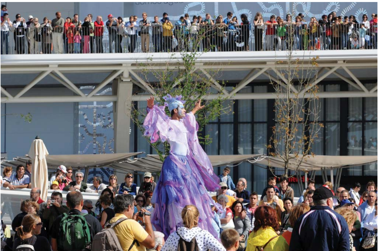
Los espectáculos y contenidos lúdicos también atrajeron la atención de los visitantes.