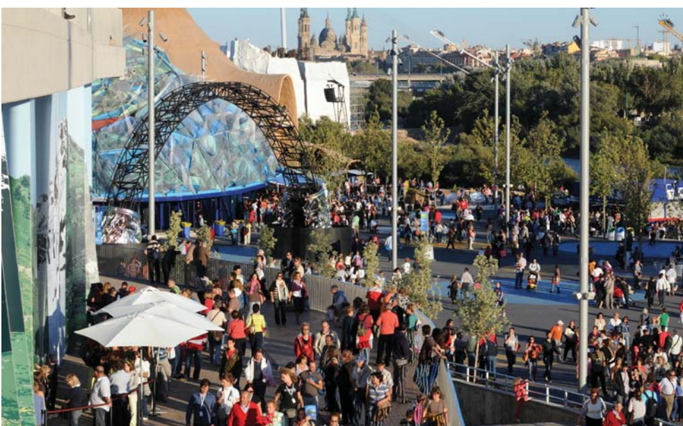
Cinco millones y medio de visitantes acudieron a Zaragoza durante la Expo.

millones de personas, muchos de ellos atraídos e interesados por los contenidos temáticos, pero también por los espectáculos y los contenidos lúdicos de esta Expo. Durante estos tres meses, más de cinco millones y medio de visitantes han pasado por la muestra, entre ellos, destacadas personalidades como el secretario general de la ONU, Ban Ki-moon, el último líder de la URSS, Mijail Gorbachov, el presidente de México, Felipe Calderón, el príncipe heredero de Holanda, Guillermo Alejandro, o el de Japón, Naruhito.