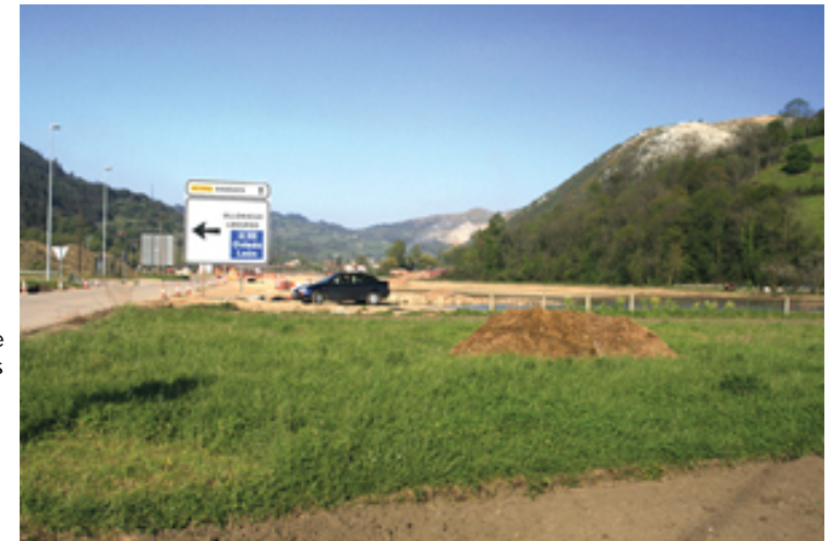
[Detalle de la vega de Tudela (Asturias) en el inicio del cambio de uso agrícola por el industrial. ]

En el norte de España el problema se agranda porque el suelo de estas características es particularmente escaso. Se restringe a los ámbitos de las vegas de los ríos y de los llanos costeros, es decir, los suelos fértiles que mantienen todavía en la actualidad las actividades primarias básicas: la agricultura y la ganadería (véase en las imágenes el ejemplo de la vega del río Nalón en Tudela-Olloniego, Asturias).