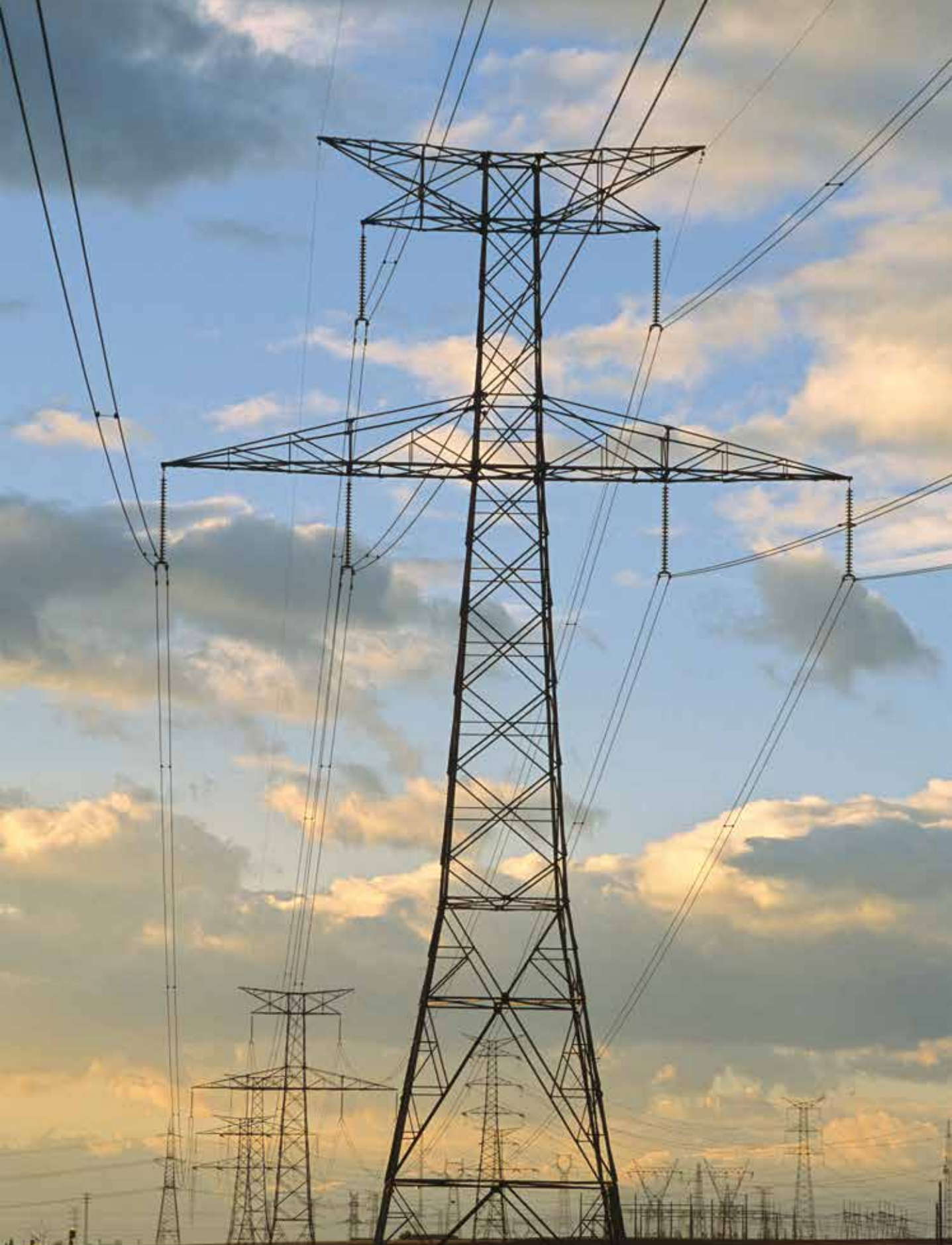
En España ha habido demandas de vecinos que entendían que la cercanía de torres de alta tensión a sus domicilios afectaba a su salud.