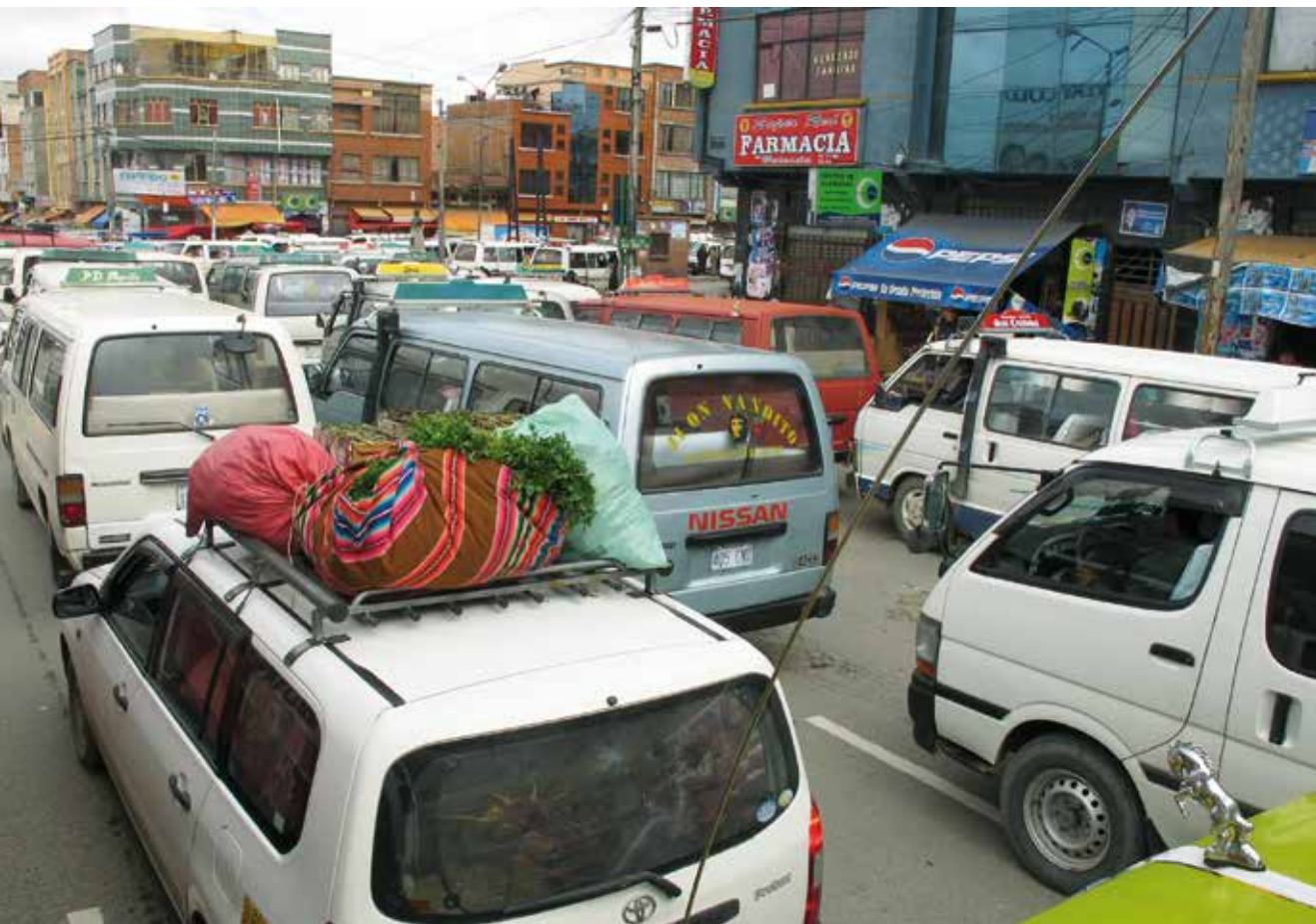
Estos ODS incluyen 17 objetivos basados en cuatro grandes retos: la reducción de la pobreza, el control de la población mundial, el fin de la desigualdad y el enfrentamiento a las amenazas medioambientales.

progresivamente el consumo y la organización social a los límites y posibilidades de los ecosistemas y las sociedades, desvinculando el incremento del bienestar (un concepto que debe concretarse con valores añadidos, entre estos disponer del tiempo) de la acumulación o consumo creciente de bienes materiales.