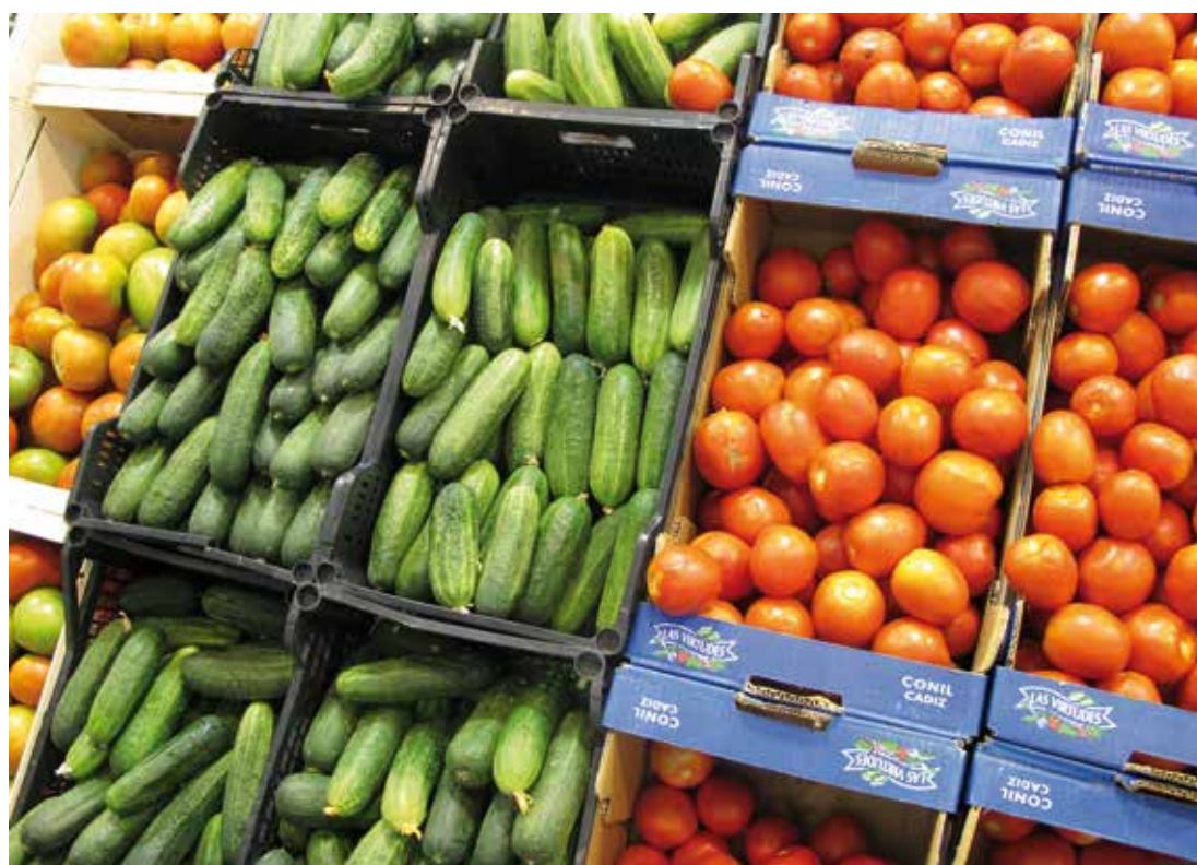
La relación entre población y producción de alimentos es cada vez más tensa.

bre las diferentes políticas del cambio climático es, en definitiva, un debate sobre las diferentes formas de combinar, dosificar, implementar y monitorizar esas medidas.