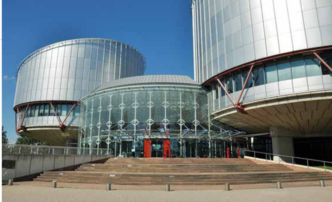
Sede del Tribunal Europeo de Derechos Humanos en Estrasburgo.

pez Ostra c. España , de 9 de diciembre de 1994 1 . Esta Sentencia ha tenido un enorme impacto