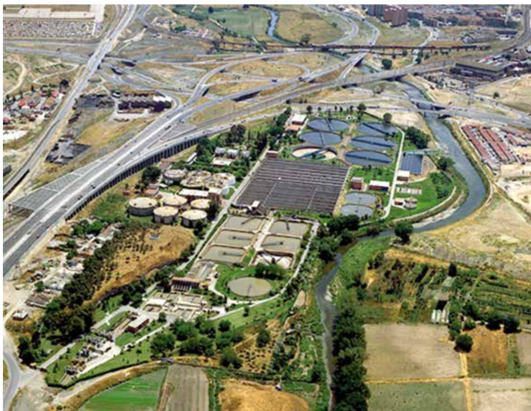
Los olores provenientes de una depuradora dieron lugar a una sentencia que tuvo un enorme impacto no sólo en España sino también en otros países europeos.

probados, no considera desproporcionada la injerencia en la vida privada y familiar que ha provocado la instalación del transformador, en la medida en que el Gobierno lo ha justificado suficientemente en base a la mejora de la prestación del servicio de energía eléctrica de la nueva instalación para la ciudad en cuestión.