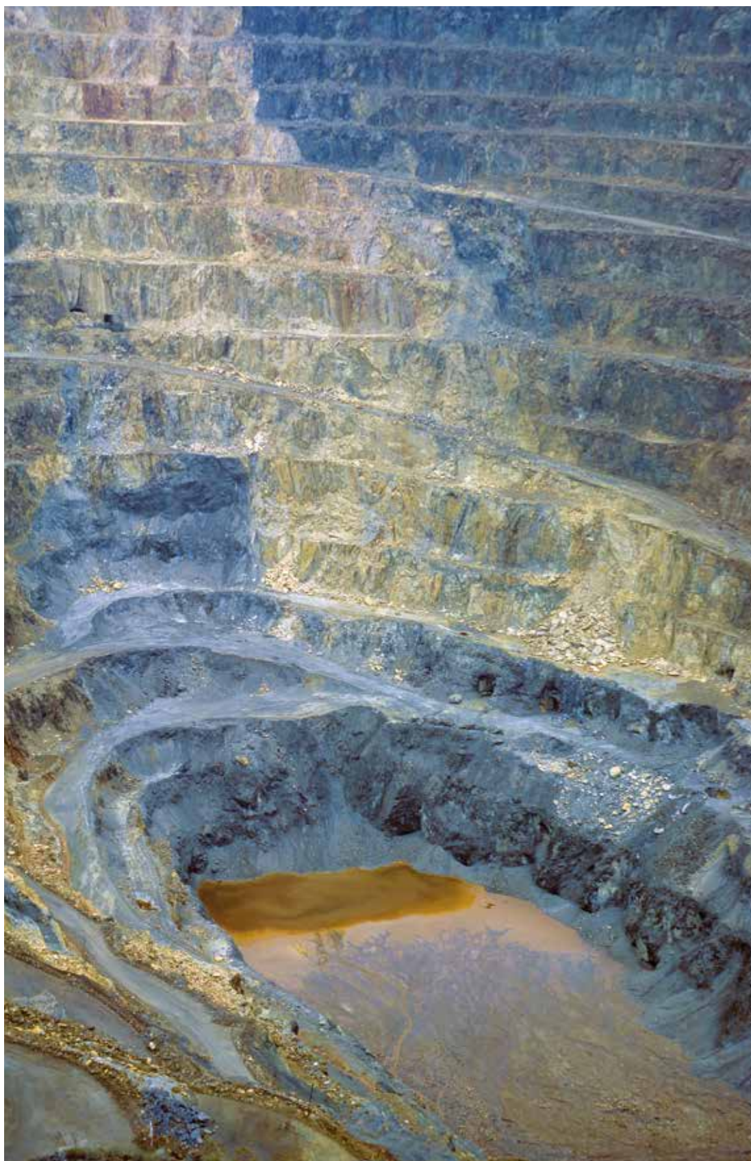
Entre las actividades consideradas peligrosas se encuentra la minería.